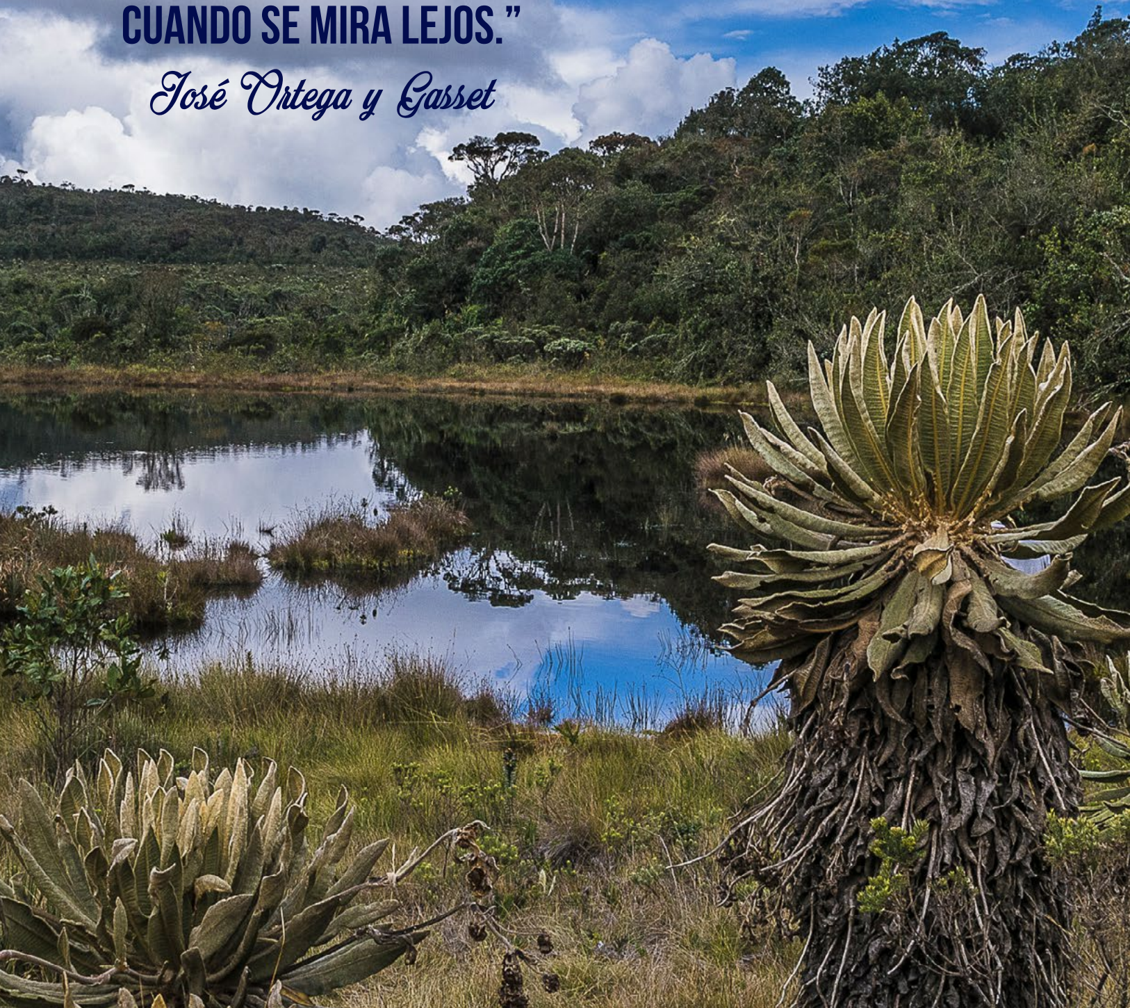
Frailejones en la Laguna de las Sabanas – Páramo de Santa Inés, Belmira Antioquia