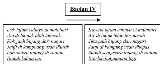
(Gambar 6. Transkrip teks dendang ‘Bujang Marantau’ bagian 4 (pantun 4) beserta terjemahannya)

Pada baris kalimat tambahan, si perempuan kemudian menegaskan harapannya pada si bujang. Kalimat tersebut berbunyi; “ pulanglah bujang dauulu ” ( pulanglah bujang dahulu ), yang artinya berharap pada si bujang untuk segera pulang. Kata dauulu ( dahulu ) di sini bukan berarti masa lampau, namun sebuah bentuk penegasan kalimat seruan pulang untuk si bujang. Kalimat tambahan yang selanjutnya menyatakan bahwa si bujang sansai ( sengsara ) di rantau. Kata sansai di sini sama dengan kata marasai pada pantun sebelumnya, yang menjelaskan paradigma umum masyarakat Minangkabau, yaitu kondisi yang dialami oleh remaja atau laki-laki yang sedang merantau.