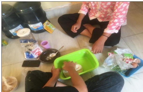
Gambar 3. Proses pembuatan adonan basreng

pembuatan adonan cilok agar nantinya saat melaksanakan program kerja mahasiswa KKN Tematik Unram tidak salah menyampaikan informasi kepada masyarakat saat melakukan sosialisasi dan pelatihan pembuatan Bakso Goreng tersebut.