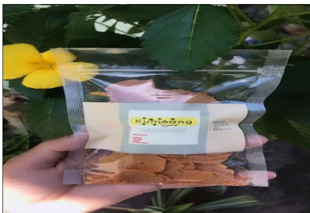
Gambar 4. Produk basreng yang siap dipasarkan

Setelah melakukan survey lokasi UMKM mahasiswa KKN Tematik Unram mencoba membuat adonan basreng dengan bahan-bahan yang sudah disediakan. Inovasi pembuatan keripik basreng ini juga dapat menjadi terobosan baru untuk masyarakat di desa kumbang yang ingin membuat usaha dengan menjual produk cilok yang telah diolah menjadi keripik basreng, maka dari itu nantinya masyarakat desa kumbang dapat mengembangkan sebuah Usaha Mikro Kecil dan Menengah (UMKM) untuk menambah penghasilannya.