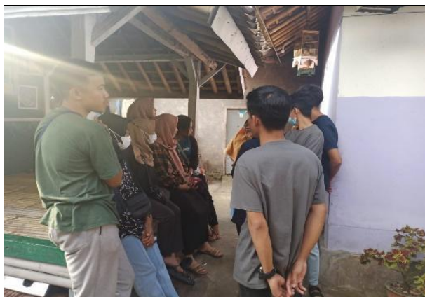
Gambar 2. Survey Lokasi UMKM

Mahasiswa KKN Tematik Unram mencoba membuat inovasi terbaru berupa keripik basreng (bakso goreng) mengingat banyak sekali pelaku UMKM cilok tidak hanya Inaq Icoq. Tujuannya agar menambah penghasilan dari pelaku UMKM tersebut dan harapannya produk yang dihasilkan oleh KKN Tematik Unram dapat diteruskan dan dikembangkan sehingga desa Kumbang memiliki satu produk khas sendiri.