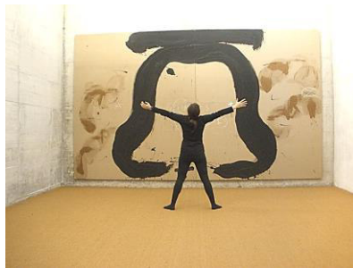
Figura 7. Interacción contemplativa. Postura X con Díptico de la campana Sala de Reflexión de Tàpies. UPF. Barcelona.

La experiencia de la observación es recreada con diferentes interacciones gestuales con la obra, la interacción es vehiculizada con las posturas inspiradas en el momento, esta experiencia a la vez es registrada, para crear un producto visual, estético, reflexivo y creativo que pretende ser el eco de la obra y la amplificación de la intención original del artista. El cual tal como manifestó en vida intentaba conectar a la sociedad a algo superior y supremo, a un nivel de conciencia no ordinario más vinculado a una realidad fundamental que a la realidad superficial que nos rodea. Desde un punto de vista de observadora activa, sensible al mensaje del artista y creativa en su forma de observar me he ido dejando llevar sin tener claro ningún resultado, atendiendo a mis propios impulsos de autoconocimiento y expansión de conciencia (véase Figura 7), recuperando y divulgando así parte del mensaje de este creador.