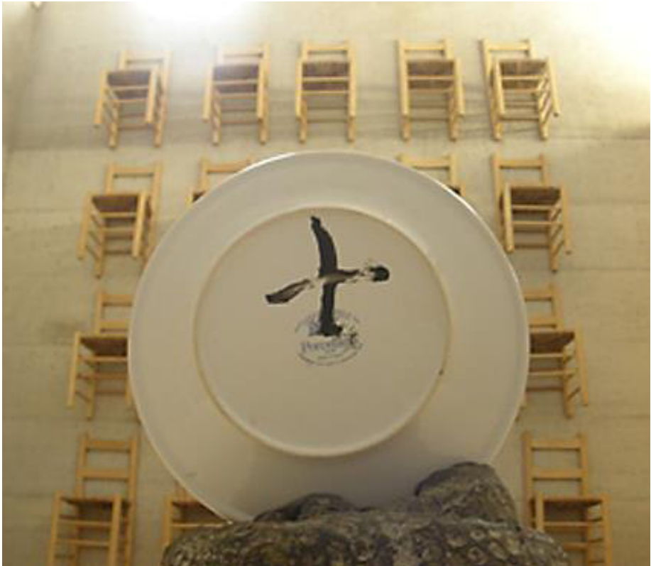
Figura 5. Mándala encubierto con forma de plato sobre fondo mural de sillas que recuerda a los hexagramas del I Ching. Sala de Reflexión de Tàpies. UPF. Barcelona.

momento contribuyen a que contemple esa obra con un grado de vivencia y creatividad más amplio y significativo.