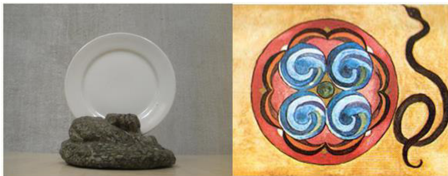
Figura 4a. Serp i Plat, 1996, Objeto escultórico, © Mónica Álvarez Font, 2012. Permiso de imagen obtenido por gentileza de la Universitat Pompeu Fabra para fines de investigación no comerciales. Sala de Reflexión de Tàpies. UPF. Barcelona / Figura 4b. Cuadro n °5 de una paciente de Jung del libro Los arquetipos y lo inconsciente colectivo Obra completa volumen 9/1 © Trotta Editorial, Madrid 2002.

orante, ahora ausente, pero en cualquier momento dispuesta a convocarse para una misteriosa eucaristía (véase Figura 5).