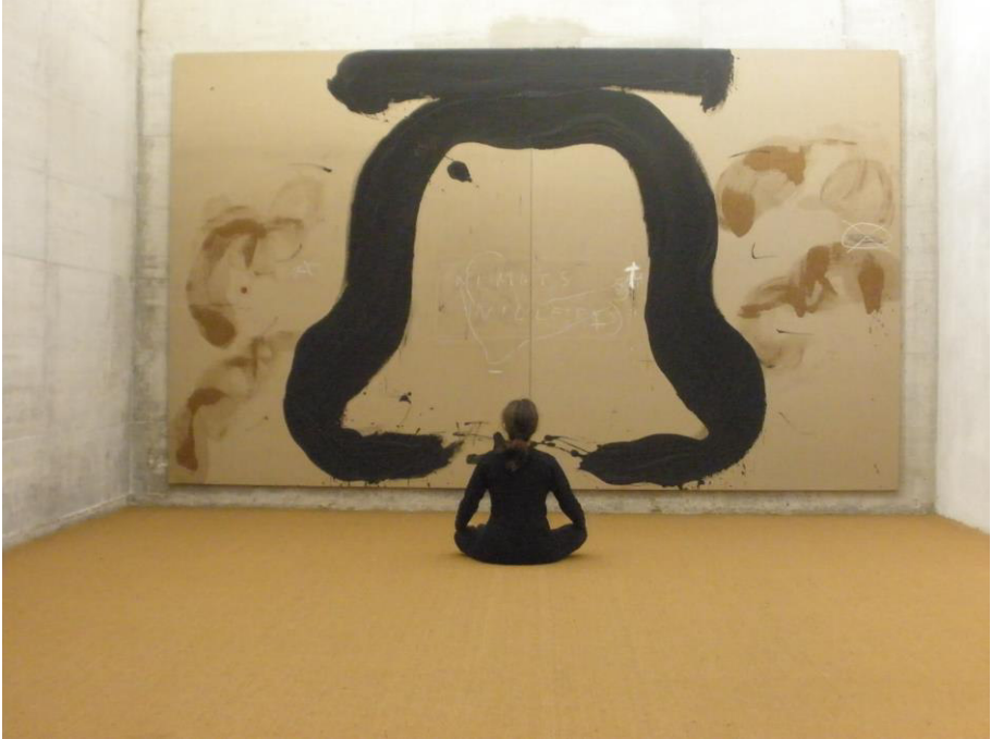
Figura 1. Interacción contemplativa: Lotus con Díptico de la campana © Mónica Álvarez Font, 2012. Permiso de imagen obtenido por gentileza de la Universitat Pompeu Fabra para fines de investigación no comerciales. Sala de Reflexión de Tàpies. UPF. Barcelona

impulso Tàpies ya que fue algo inspirado por el mensaje y las intenciones de su obra. Este impulso me condujo de forma ineludible a explorar la Sala de Reflexión y conectar mediante una interacción contemplativa realizada en esta sala con parte del mensaje que nos dejó este creador (véase Figura 1).