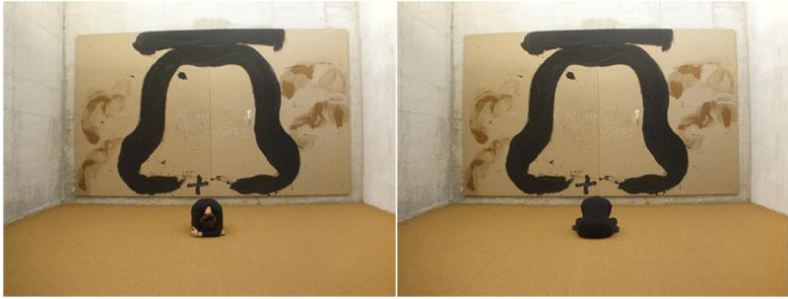
Figura 6a/ 6b. Interacción contemplativa: Ding-Dong con Díptico de la campana © Mónica Álvarez Font, 2012. Permiso de imagen obtenido por gentileza de la Universitat Pompeu Fabra para fines de investigación no comerciales. Sala de Reflexión de Tàpies. UPF. Barcelona.

La experiencia de la observación es recreada con diferentes interacciones gestuales con la obra, la interacción es vehiculizada con las posturas inspiradas en el momento, esta experiencia a la vez es registrada, para crear un producto visual, estético, reflexivo y creativo que pretende ser el eco de la obra y la amplificación de la intención original del artista. El cual tal como manifestó en vida intentaba conectar a la sociedad a algo superior y supremo, a un nivel de conciencia no ordinario más vinculado a una realidad fundamental que a la realidad superficial que nos rodea. Desde un punto de vista de observadora activa, sensible al mensaje del artista y creativa en su forma de observar me he ido dejando llevar sin tener claro ningún resultado, atendiendo a mis propios impulsos de autoconocimiento y expansión de conciencia (véase Figura 7), recuperando y divulgando así parte del mensaje de este creador.