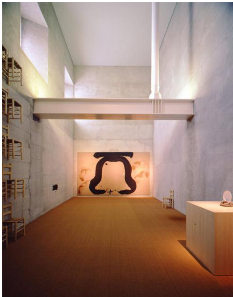
Figura 2. Páginas del diario impulso Tàpies 2012. Manuscrito, fotocopias y fotos de Mónica Álvarez Font ©. Se aprecia la imagen de Tàpies trabajando en una gran campana escultórica en el estudio de Hans Spinner, 1986.

la misma búsqueda hacia una renovada espiritualidad que llevó a Tàpies a indagar incesantemente en las religiones orientales y sus sistemas de saber que tan afines me resultaban. Empecé un diario titulado impulso Tàpies para poner orden y gestionar de alguna manera lo que sentía como algo valioso apunté en él: “es como si algo de allí, de ese espacio me estuviera llamando, la ensordecedora campanada silenciosa” (véase Figura, 2).