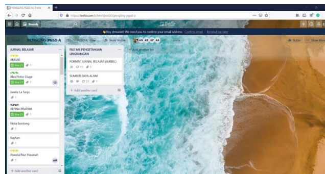
Gambar 4.2 Tampilan Portofolio Berbasis Trello