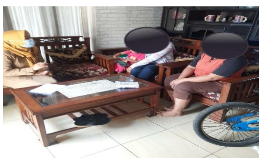
Gambar 2. Kegiatan Pendampingan Praktek Deteksi Kesehatan Jiwa Keluarga

Evaluasi pelatihan CMHN dilakukan di akhir pelatihan yaitu mengukur tingkat pengetahuan perawat tentang peran dalam memberikan pelayanan kesehatan jiwa di masyarakat dengan cara membagikan instrumen pertanyaan menggunakan google form. Hasil dari pelatihan yang diikuti oleh perawat pengelola program kesehatan jiwa tersebut menunjukkan adanya peningkatan pengetahuan sebesar 20 dengan melihat skor perubahan pada hasil rata-rata pre tes 61 dan post tes menjadi 81.