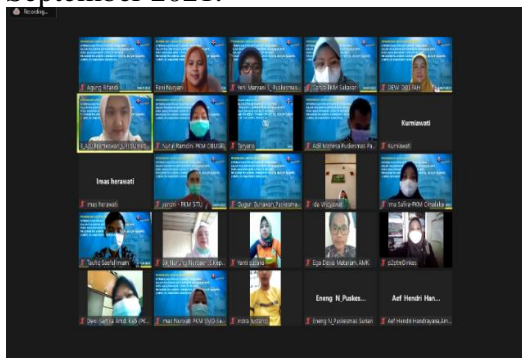
Gambar 1. Kegiatan Pelatihan CMHN dengan daring

dengan cara luring pada tanggal 29 September 2021.