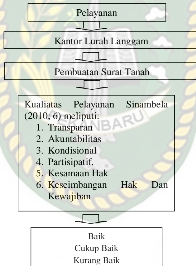
Gambar II.1 : Kerangka Pikir Penelitian Tentang Kualitas Pelayanan Pembuatan Surat Tanah Di Kantor Lurah Langgam Kecamatan Langgam Kabupaten Pelalawan

Dalam penelitian ini peneliti menetapkan Kerangka pikir penelitian sebagaimana terlampir pada gambar dibawa ini :