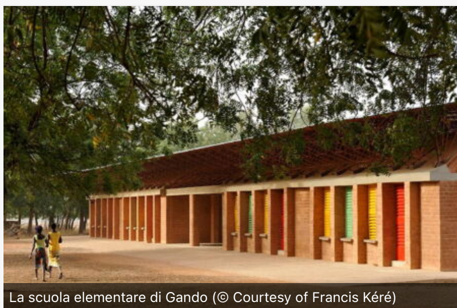
La scuola elementare di Gando (© Courtesy of Francis Kéré)

Immagine di copertina: courtesy of Lars Borges