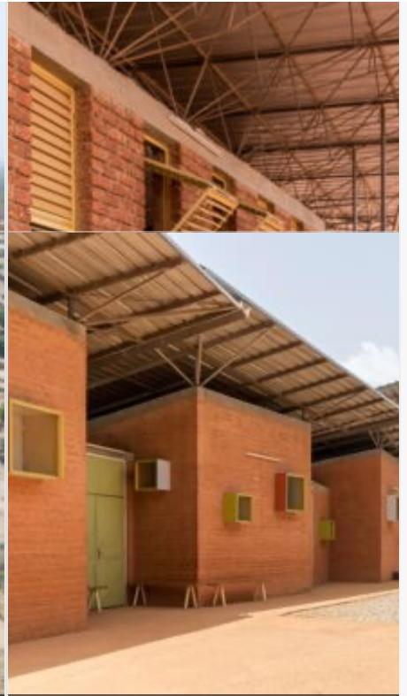
Ambulatorio Chirurgico e Centro S Kéré)