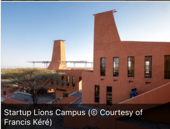
Startup Lions Campus (© Courtesy of Francis Kéré)