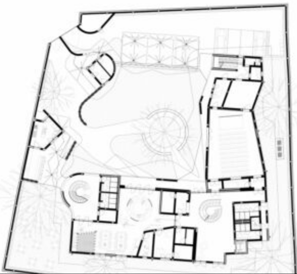
Goethe Institute, Senegal (© Kéré Architecture)