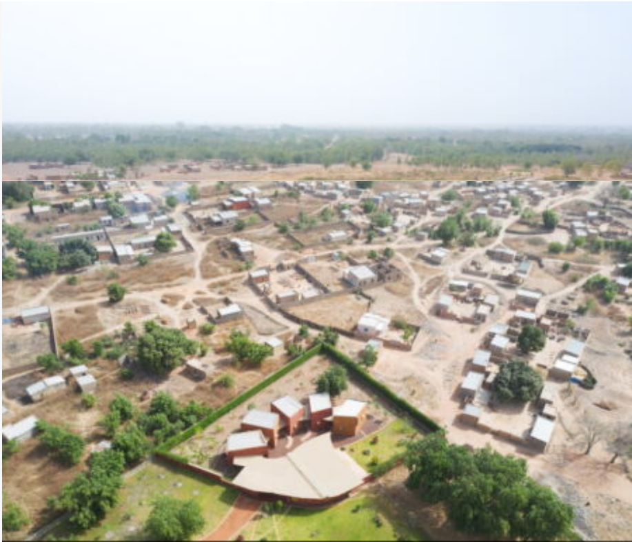
Ambulatorio Chirurgico e Centro Sanitario