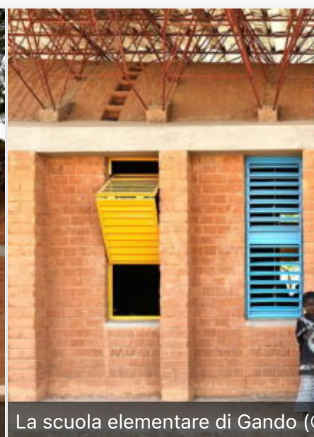
La scuola elementare di Gando (©