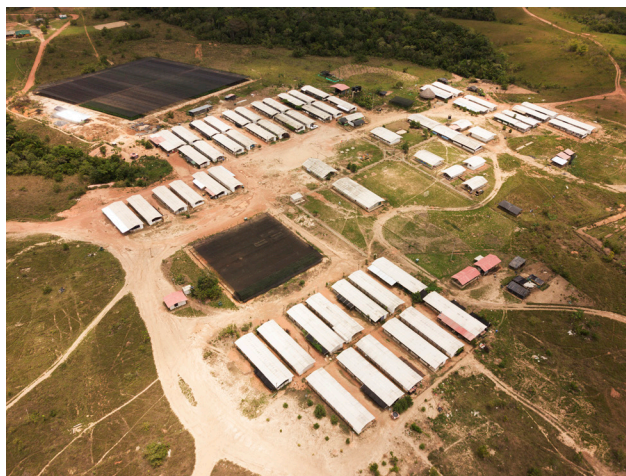
Figura 3. ETCR Marco Aurelio Buendía, San José del Guaviare

El uso de herramientas para la acción y la participación en el diseño ha sido recurrente también en el diseño para la innovación social, una disciplina en evolución cuyos objetivos abordan ámbitos como lo social, lo cultural y la economía local (Irwin, 2015, p. 230). El diseño para la innovación social parte del cuestionamiento sobre el papel del proyecto en sus