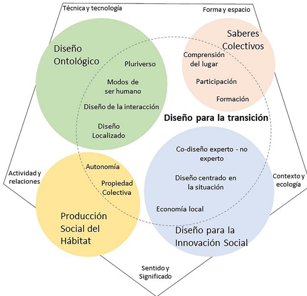
Figura 4. Aportes al diseño para la transición desde algunas prácticas de diseño relacionadas

Una práctica emergente surgida en América Latina como respuesta a las rupturas asociadas a la transición es la producción social del hábitat. Esta se plantea como un proceso alternativo y viable a los modelos de vivienda controlados por el estado y las grandes constructoras privadas que no contemplan la participación de los habitantes y que, con frecuencia, tampoco garantizan una vivienda adecuada. Por el contrario, estos procesos presentan escenarios de participación comunitaria que promueven la autonomía, la autogestión y la propiedad colectiva. “Para millones de personas, se trata de una alternativa, a veces la única, para convertir en realidad el acceso a un derecho social fundamental como es la vivienda adecuada” (Coalición Internacional para el Hábitat - oficina para América Latina HIC-AL, 2017, p. 9). La producción social del hábitat es, en consecuencia, “una de las disciplinas llamadas a la formulación de herramientas aplicables que permitan superar la desigualdad física y social del territorio urbano, lo que resulta de su entera competencia” (Sepúlveda, 2012, p. 155) y,