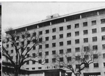
Il Peace Hotel a Pechino (1953)