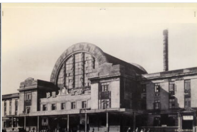
La stazione di Liaoning a Shenyang (1927)