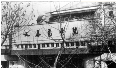
Il Dahua Cinema a Nanchino (1935)