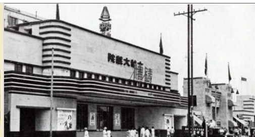
Il Dahua Cinema a Nanchino (1935)