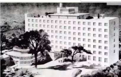
Il Peace Hotel a Pechino, disegno (1953)