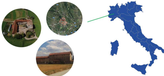
Fig. 3 - Il contesto di applicazione: il sistema delle cascine storiche nell’area periurbana del comune di Volpiano (TO).

Il caso è stato presentato in occasione di due conferenze internazionali [8, 22]: in esso i processi analitici e decisionali di supporto alle politiche di rigenerazione urbana e valorizzazione dei contesti periurbani sono stati condotti adottando una prospettiva originale e innovativa, ovvero impiegando inizialmente i principi di responsabilità sociale d’impresa [8] per poi integrarli con i paradigmi dell’approccio social impact-oriented [22].