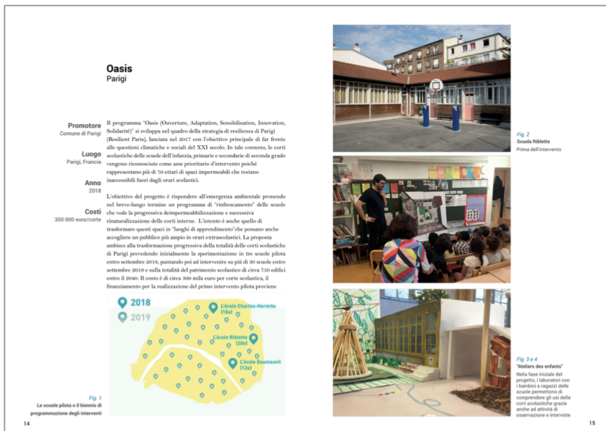
Figura 3 | Un estratto dal documento Repertorio : una delle schede dedicata all'esperienza del programma Oasis, avviato dalla municipalità parigina e mirato ad intervenire su cortili e pertinenze scolastiche (dal Report di progetto).