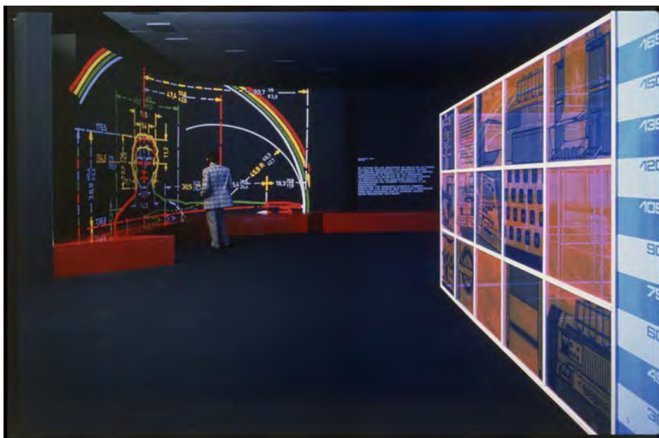
Fig. 4 — G. Colombo, interni della mostra Olivetti Investigación y Diseño , Barcellona, Pabellon Italiano de la Feria de Muestras, 18 febbraio - 6 marzo 1970. Associazione Archivio Storico Olivetti, Ivrea.