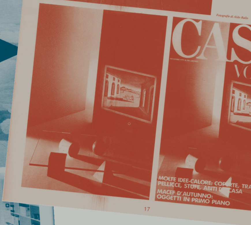
Fotografie di Aldo Ballo