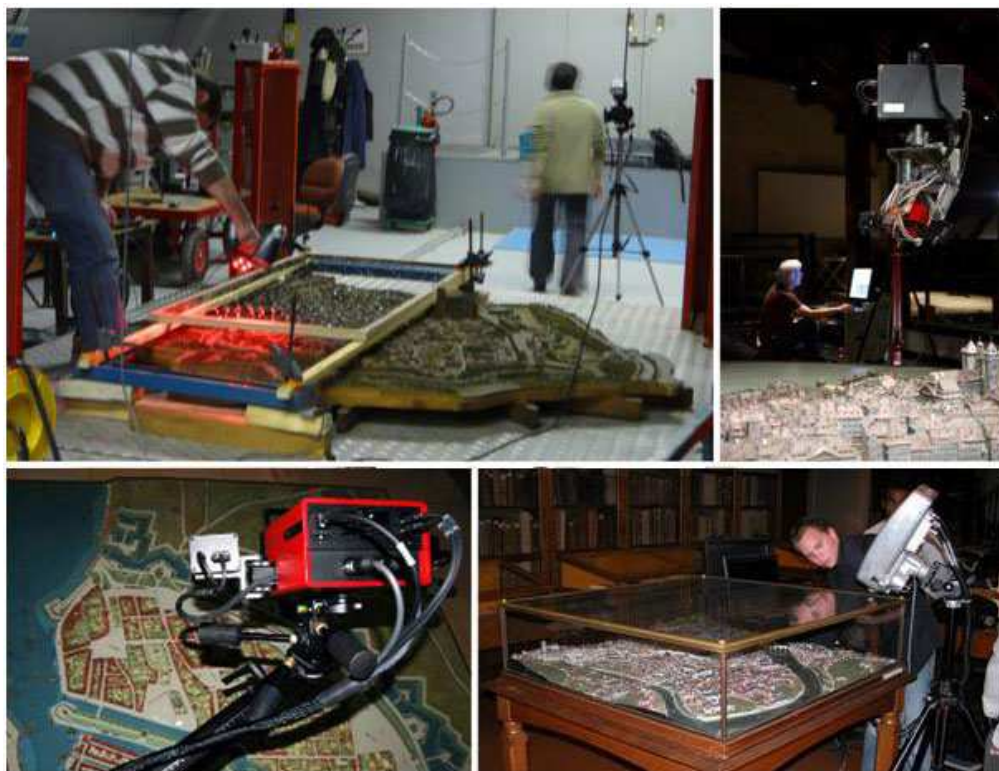
Fig. 2. Alcuni esempi di modelli plastici di città e strumenti di digitalizzazione (Jacquot 2014, p. 41).

Un caso a parte nel panorama europeo è quello francese del museo nazionale dei Plans-reliefs, che conserva un centinaio di plastici di architettura militare costruiti dalla fine del XVII secolo alla fine del XIX secolo, appartenenti ad una collezione che nel 1927 è stata classificata monumento storico. Ad essi si aggiungono una cinquantina di modelli teorici, di tipo pedagogico, realizzati tra il XVIII e il XIX secolo per l'insegnamento nelle scuole militari. Il museo, aperto nel 1943 è attualmente in corso di rifunzionalizzazione, mirata ad espandere lo spazio di visita, fino ad oggi limitato all'esposizione di un solo terzo della collezione.