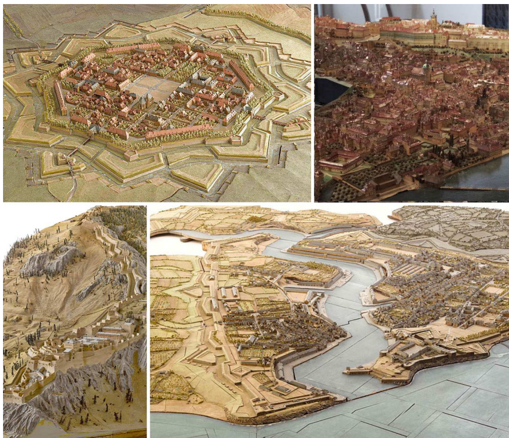
Fig. 1. Alcuni esempi di modelli plastici di fortificazioni alle diverse scale. Plan-Relief di Neuf-Brisach, Musée des Plans-Reliefs, Paris; maquette di Praga nel XVIII secolo, Muzeum Hlavního Města Prahy; Plan-Relief del Forte di Fenestrelle, Musée des Plans-Reliefs, Paris; Plan-Relief di Brest, Musée des Plans-Reliefs, Paris.

Il processo di valorizzazione che passa attraverso la tutela registra, anche se in maniera non omogenea, un orientamento che negli ultimi anni ha manifestato un rinnovato interesse nei confronti di questo repertorio, trovando negli strumenti digitali di rilievo e acquisizione metrica una delle possibili chiavi per la messa a sistema dei dati che lo caratterizzano e che anticipa interessanti sviluppi anche in relazione alla fruizione di questo materiale, anche attraverso la rete.