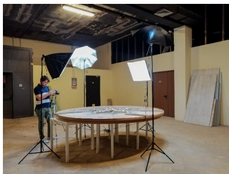
Fig. 3. Plastico della Cittadella di Torino. Allestimento della scena per la presa fotografica.

In ambito locale si sono avviati lavori di ricerca che intendono studiare, digitalizzare e valorizzare i plastici fisici relativi alla cinta fortificata della città, conservati presso il Museo Pietro Micca e presso Museo Storico Nazionale di Artiglieria della città di Torino. Si tratta di un materiale eterogeneo, per epoca e tecnica di realizzazione, poiché rappresenta le opere fortificate della città nel loro complesso ed alcune emergenze che ne costituiscono elementi chiave: il plastico relativo all'assedio del 1706, il plastico della cittadella, i plastici relativi al Maschio e al Cisternone.