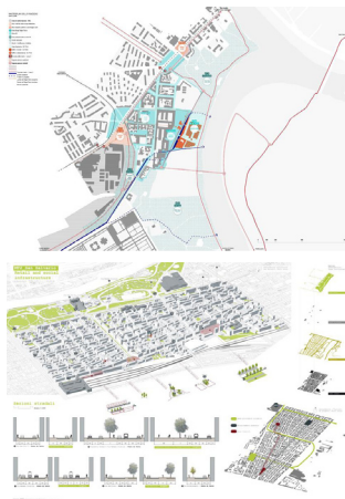
Fig. 1: Fermata MT2 Cimarosa-Tabacchi: "la città del loisir acquatico" come paesaggio costruito soft-tech, tra urbano e periurbano.

L'obiettivo, utilizzando come lente critica il paradigma del built environment , è quello di indagare un tema potenzialmente ricorrente nel prossimo futuro dei nuclei urbanizzati: in che modo una importante infrastruttura per la mobilità, concepita come sequenza di stazioni standardizzate, possa recuperare il suo fondamentale ruolo di agente di rigenerazione urbana dell'intorno, in conseguenza del ribilanciamento che introduce nel policentrismo urbano.