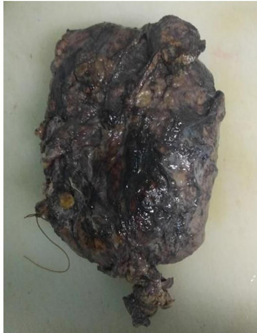
Fig. 1. Lesión tumoral resecada.

El transoperatorio transcurrió sin complicaciones y el espécimen quirúrgico resecado se envió al examen definitivo anatomopatológico.