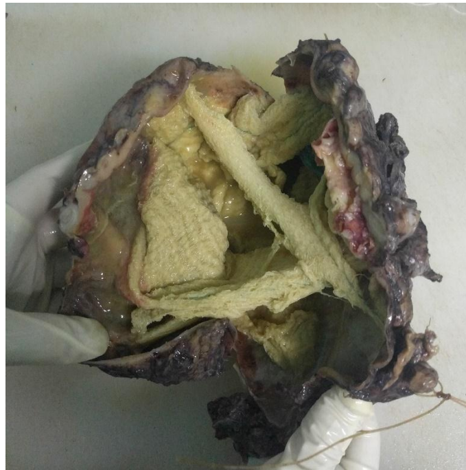
Fig. 2. Al corte se ilustra cavidad quística con resto de material textil (compresa).

Histológicamente: masa quística de contenido purulento con evidencia de oblitoma (cuerpo extraño tipo compresa). Contorno quístico definido por pseudocápsula de tejido conectivo que muestra proceso inflamatorio crónico granulomatoso a cuerpo extraño, necrosis y hemorragia. Cuadro histológico consistente con oblitoma abdominal quirúrgico. (Figura 3)