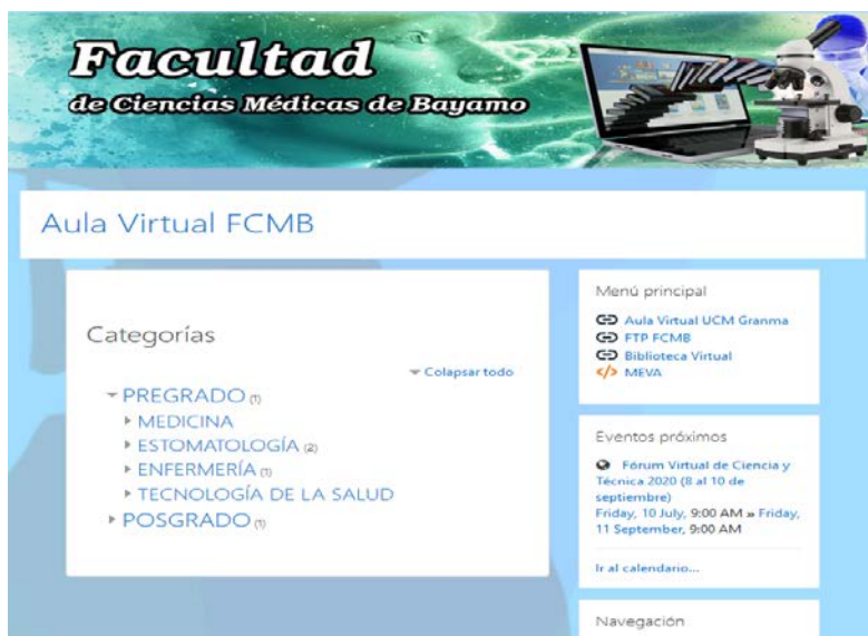
Fig.1. Aula Virtual FCMB. Interfaz principal.

La portada del Aula Virtual de la Facultad de Ciencias Médicas de Bayamo muestra esencialmente un listado de los cursos disponibles y bloques de información y/o administración de manera personalizada, en dependencia del rol del usuario autenticado. Los bloques proporcionan información o funcionalidad adicional en los márgenes laterales de la ventana del sitio, como se muestra en la figura 1.