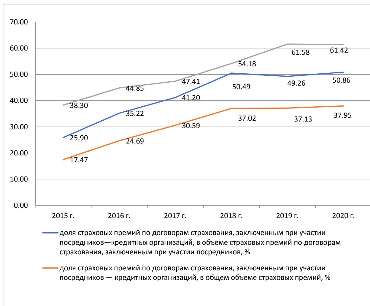
Рис. 2 / Fig. 2. Динамика показателей, характеризующих роль банков как посредников страховых компаний, за 2015–2020 гг. / Dynamics of indicators characterizing the role of banks as intermediaries of insurance companies in 2015–2020