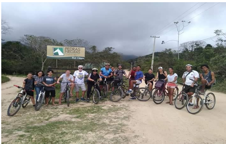
Figura 10. Hotel-Fazenda Pedras Negras

margens da BR-101, em direção ao Norte Fluminense. Uma das principais estratégias do hotel é a realização de pacotes temáticos em diferentes épocas do ano, com a estratégia do escapismo dos problemas urbanos e o contato com o “natural” com passeios a cavalo. O hotel-fazenda também se tornou um ponto de algumas atividades esportivas e de ecoturismo, como caminhadas e passeios ciclísticos.