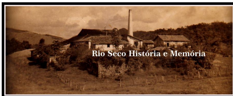
Figura 2. Antiga fazenda de engenho de cana-de-açúcar Rio Seco