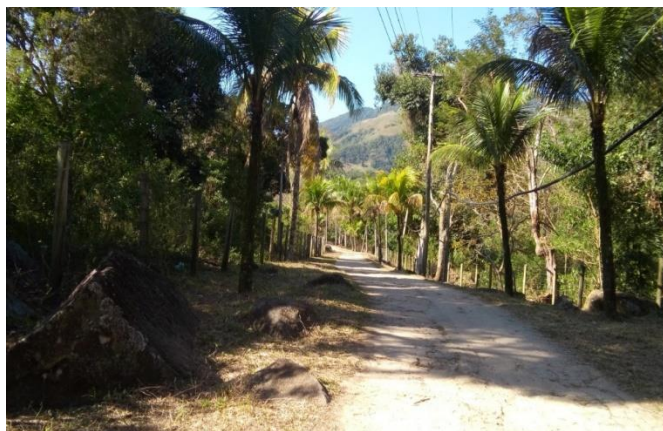
Figura 9. Estrada para a Fazenda São Judas Tadeu