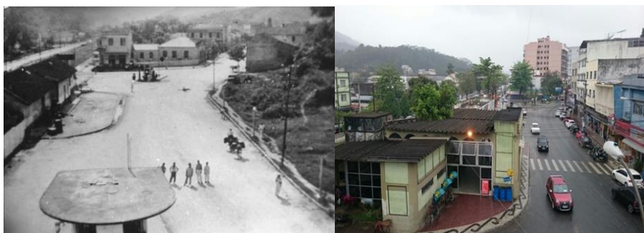
Figura 6. Vista para a Rua Getúlio Vargas e Praça Astério Alves de Mendonça em Rio Bonito