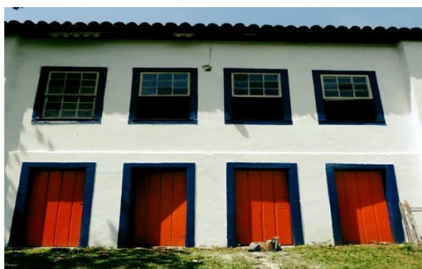
Figura 3. Fachada restaurada da Fazenda Rio Vermelho