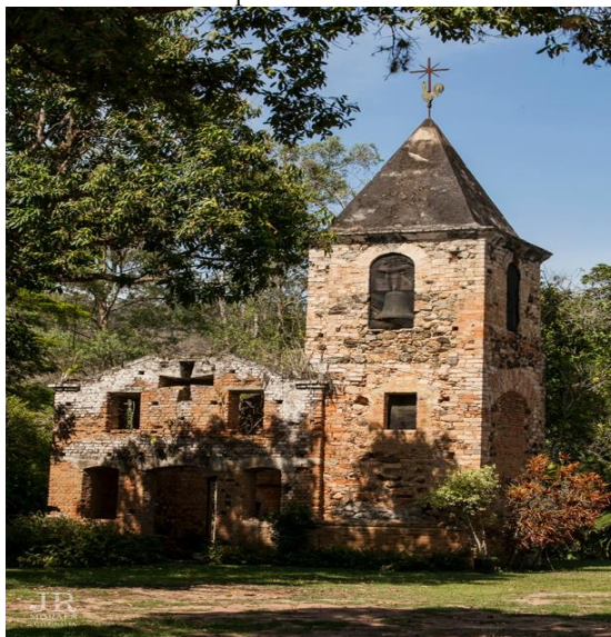
Figura 11. Ruínas da Capela de Nossa Senhora da Conceição