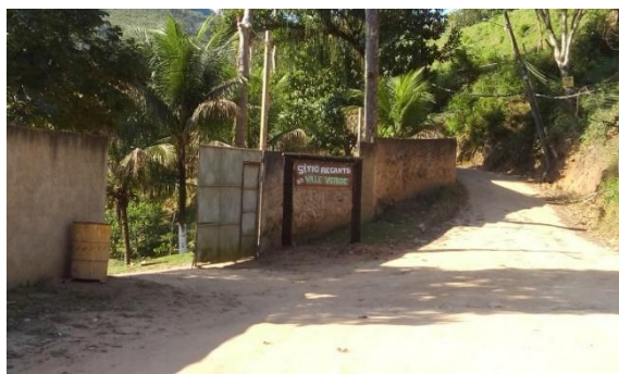
Figura 8. Estrada Cachoeiras dos Bagres, Rio Bonito e fachada do Sítio Recanto do Vale Verde

Com essa transformação na área rural de Rio Bonito, onde encontrávamos fortes atividades agrícolas e, devido principalmente aos processos de industrialização e expansão urbana, o espaço rural do município sofreu fortes mudanças na sua composição. Nas figuras a seguir é possível identificar alguns exemplos de segunda residência na área rural de Rio Bonito.