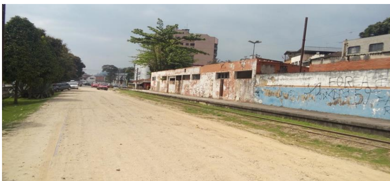
Figura 5. Antiga estação ferroviária de Rio Bonito em 2017