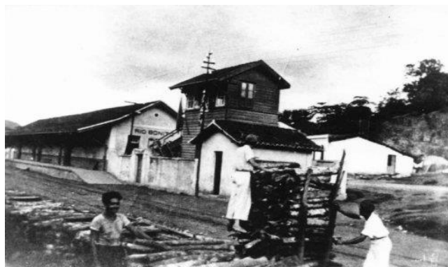
Figura 4. Estação ferroviária de Rio Bonito (década de 1960)