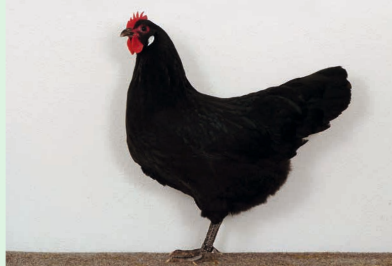
Henne, schwarz, aus der Zucht J. Mojzis, Frickenhausen

Das Sachsenhuhn wird sowohl in der Liste des Fachbeirates Tiergenetische Ressourcen des Bundesministeriums für Ernährung, Landwirtschaft und Verbraucherschutz (BMELV) als auch in der Roten Liste der Gesellschaft zur Erhaltung alter und gefährdeter Nutztierassen e.V. (GEH) in der Kategorie I – extrem gefährdet – geführt.