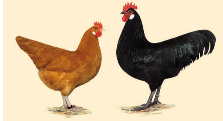
Standardbild ab 2010

Eine weitere Zäsur war der 2. Weltkrieg. Nach dem Krieg machten sich wenige Züchter auf, mit dem noch vorhandenen Rest an Zuchttieren den Erhalt der Rasse zu sichern. Durch die Teilung Deutschlands wurde die Zucht zusätzlich erschwert. 1963 rief Theo Dubiella im Westen Deutschlands einen Sonderverein (SV) ins Leben. Im Osten kümmerte sich die Spezialzuchtgemeinschaft (SZG) Sachsenhuhn um die Weiterentwicklung der Rasse. Helmut Esche, Heino Michaelis, Günter Hallbauer, Gotthard Döring, Manfred Künzel und Günter Eibisch brachten die Züchtung des Sachsenhuhns mit viel Engagement voran. Später kamen Horst Fricke und Karl-Heinz Döring dazu.