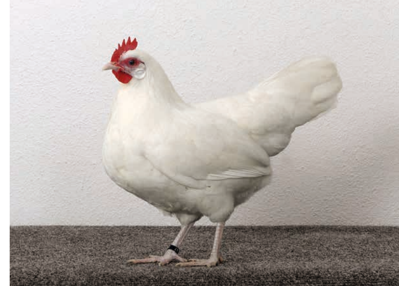
Zwerghenne, weiß, aus der Zucht S. Werner, Gablenz

Farbenschlag mehr Unterstützung. Zu beachten ist, dass im Gegensatz zu den Mittelmeerrassen kleine Kopfpunkte erwünscht sind. Zuchtziel sind kleine, feste Kämme, die sich harmonisch anpassen.