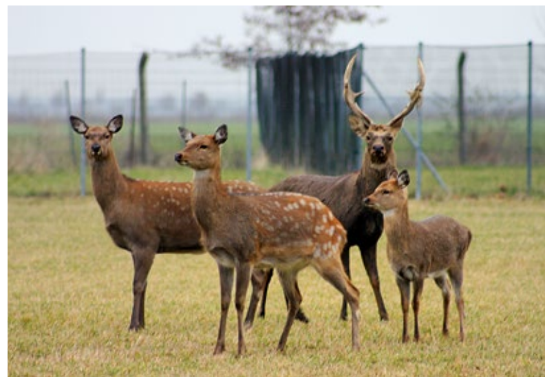
Sikahirsch mit Alttieren und Kalb

Ein weiteres Unterscheidungsmerkmal zwischen Dam- und Sikawild ist die Ausprägung des Geweihs. Während der Damhirsch ein Schaufelgeweih trägt, haben Sikahirsche ein bis zu achtendiges Geweih, dessen Stangen 40 bis 65 cm lang werden. Sikahirsche werfen ihr Geweih jährlich Mitte April bis Mitte Mai ab. Die Neubildung dauert bis August.