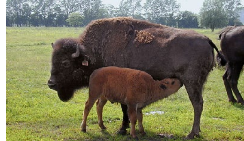
Bisonkuh mit Kalb

An Kopf, Schultern und Vorderbeinen hängt dunkelbraunes, zotteliges Fell. Im Winter ist dieses dunkler und dichter. Die kupferbraune Hinterhand ist dagegen nur wenig behaart. Kälber haben ein helles, rotbraunes Fell. Beide Geschlechter tragen Hörner, die verhältnismäßig klein und leicht nach innen gebogen sind.