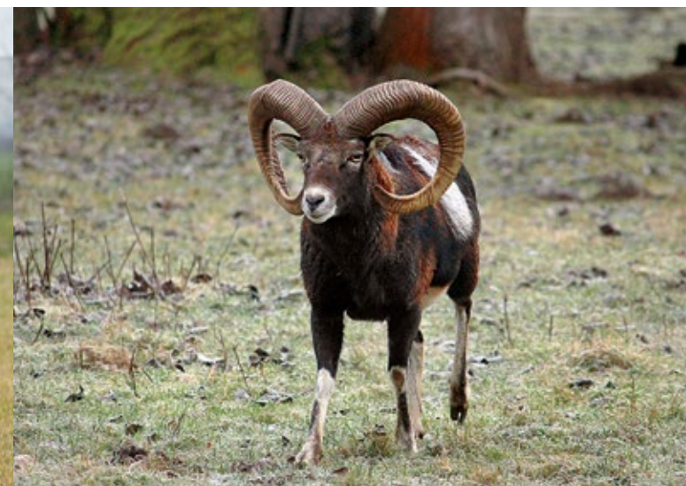
Muffelwidder mit typischem hellem Sattelfleck

sind die größten nordamerikanischen Säugetiere und gelten als »Wildrinder«. Charakteristisch sind der massive dreieckförmige Kopf mit einem kräftigen Bart, der mächtige Brustkorb und der auffällig ausgeprägte Schulterbuckel.