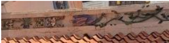
Gambar 6. Ukiran Flora dan Fauna Atap Candra Naya

Elemen dinding Candra Naya banyak menerapkan ornamen yang bervariasi, yang diterapkan pada pintu, jendela, dan partisi. Pada bagian pintu menerapkan warna hitam yang memiliki makna mengenai kehidupan, dengan menerapkan ornamen ukiran bentuk flora jamur lingzhi, menurut Salim (2016), bermakna untuk melambangkan panjang umur kehidupan dan bentuk geometri delapan arah mata angin atau pa kua bermakna sebagai penolak bala menurut kepercayaan budaya Cina. Ornamen-ornamen pada Candra Naya dominan menggunakan warna emas dengan makna melambangkan warna surga.