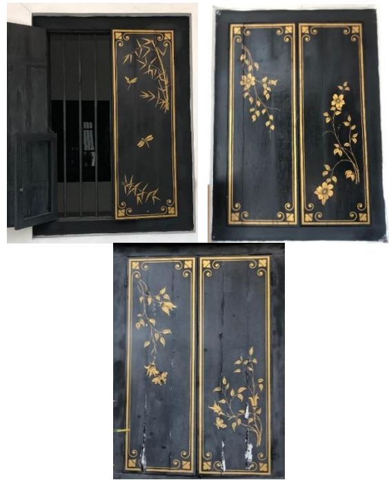
Gambar 9. Ornamen lukisan bentuk flora pada jendela.

pintu bagian depan bangunan dihiasi dengan ukiran ornamen hias bentuk flora bunga Teratai.