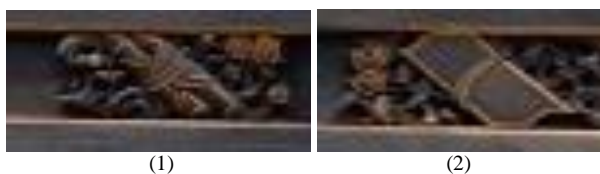
Gambar 2. Ukiran Gulungan Lukisan (1), Ukiran Buku (2).

Pada elemen atap Candra Naya digunakan struktur Tou Kung yang merupakan kuda-kuda khas Cina dengan hiasan ornament ukiran bentuk gulungan lukisan (1) dan buku (2) dengan makna melambangkan pemilik bangunan Candra Naya merupakan cendekiawan dan kaya raya (Naniek Widayati, 2003).