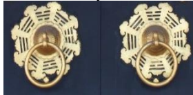
Gambar 8. Ornamen bentuk delapan arah mata angin.

Bagian jendela dominan menggunakan ornamen floral yang bervariasi dengan menerapkan kombinasi warna hitam dan emas. Ornamen-ornamen tersebut yaitu bentuk flora bambu yang merupakan tanaman dengan empat sifat kebajikan dan bunga peony, persik dan azalea dengan makna keteguhan hati yang dibuat dengan ukiran berwarna emas. makna-makna yang ada didalamnya dipercaya sebagai penolak bala bagi penghuni bangunan (Moedjiono, 2011). Pada jendela dan