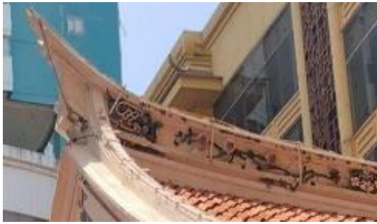
Gambar 5. Atap Candra Naya