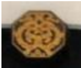
Gambar 7. Ornamen Ukiran Jamur Lingzhi.

Elemen dinding Candra Naya banyak menerapkan ornamen yang bervariasi, yang diterapkan pada pintu, jendela, dan partisi. Pada bagian pintu menerapkan warna hitam yang memiliki makna mengenai kehidupan, dengan menerapkan ornamen ukiran bentuk flora jamur lingzhi, menurut Salim (2016), bermakna untuk melambangkan panjang umur kehidupan dan bentuk geometri delapan arah mata angin atau pa kua bermakna sebagai penolak bala menurut kepercayaan budaya Cina. Ornamen-ornamen pada Candra Naya dominan menggunakan warna emas dengan makna melambangkan warna surga.