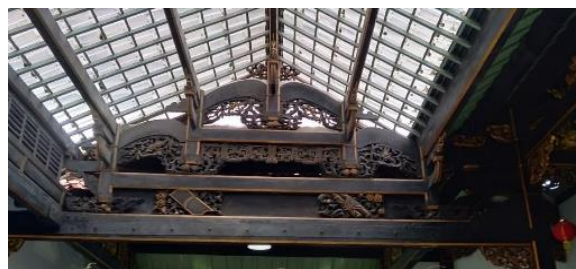
Gambar 4. Struktur atap tou kung .

Bentuk atap terbuka di bangunan Candra Naya terletak pada bagian tengah bangunan ( courtyard ) yang harusnya memiliki atap terbuka, namun setelah penyesuaian dengan iklim Indonesia perancang bangunan membuat bentuk atap skylight sehingga masih ada cahaya yang dapat masuk ke bangunan.