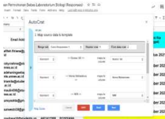
Gambar 3. Proses mail merge data yang telah diinput menggunakan Pengaya ( Add-Ons ) Autocrat

Pengaya ( Add-ons ) Autocrat digunakan dalam proses mail merge data dan menyusun ke dalam format ( portabel dokumen format (PDF) ). pada saat yang sama data yang telah digabung menjadi dokumen PDF dan dikirim langsung ke alamat surat elektronik/e-mail pemohon. Untuk dapat digunakan pada Google Sheets, pengaya Autocrat terlebih dahulu di- install pada Google Sheets melalui Google Webstore.