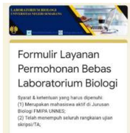
Gambar 1. Tampilan pengguna ( user interface ) pada sistem bebas laboratorium

Isian data dan dokumen yang telah diinput oleh pemohon pada aplikasi google form secara otomatis akan tercatat pada aplikasi google sheets . data di google sheets ini dijadikan sebagai database. kemudian dilakukan penambahan beberapa kolom untuk proses verifikasi dan validasi isian data dan dokumen pembuatan surat keterangan bebas laboratorium sebagai berikut: