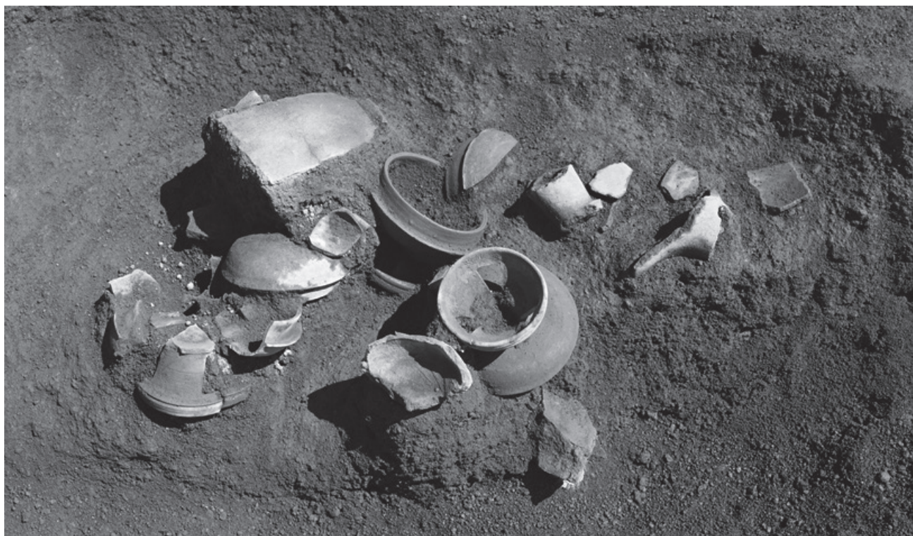
図6 墓前祭祀跡（古墳時代後期）