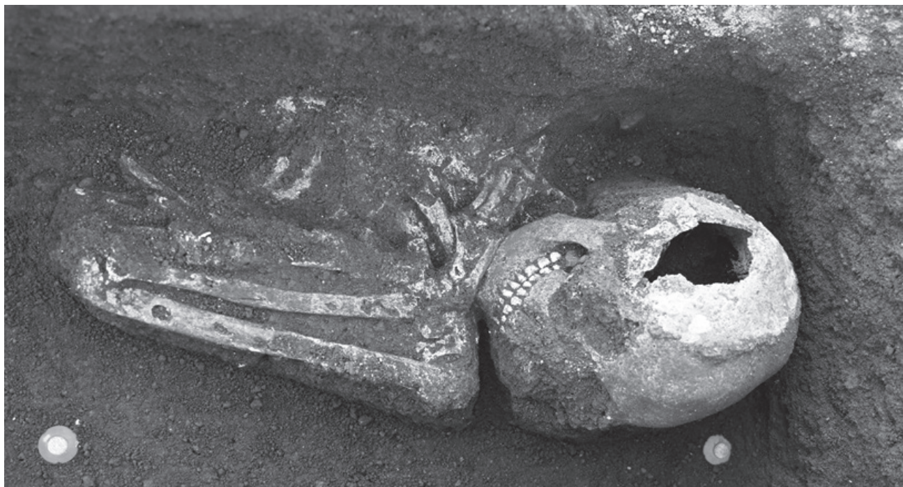
図5 成川遺跡2021-1号墓人骨（女性・壮年）出土状況