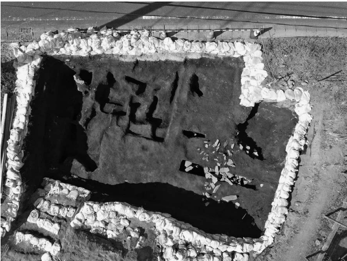
図2 成川遺跡第4次2021年発掘調査区 (7トレンチ)