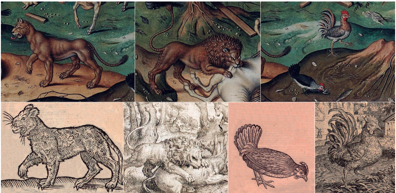
Figura 7. Detalhes da “Arca de Noé sobre o Monte Ararat” de Simon de Myle comparados com ilustrações de Barthélemy Aneau (1549), Conrad Gesner (1555) e Marcus Gheeraerts (1567).