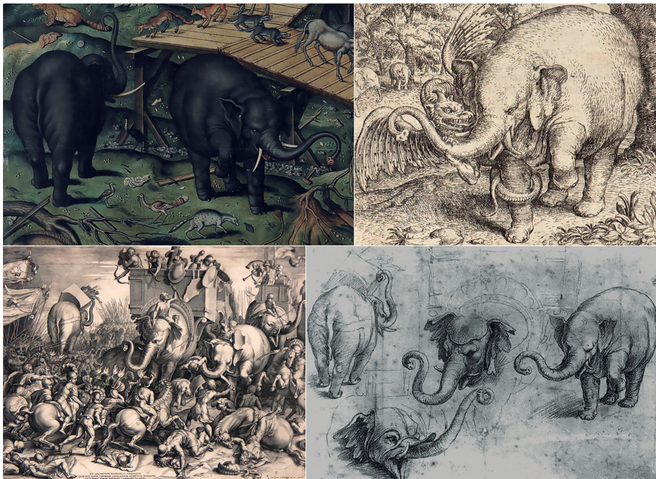
Figura 6. Da esquerda para a direita, de cima para baixo: elefantes retratados na “Arca de Noé” de Simon de Myle, na “Warachtighe Fabulen der Dieren” de Marcus Gheeraerts (1567), na gravura de Cornelis Cort (1567) e no estudo geralmente atribuído a Raffaello de Sanzio (sem data).