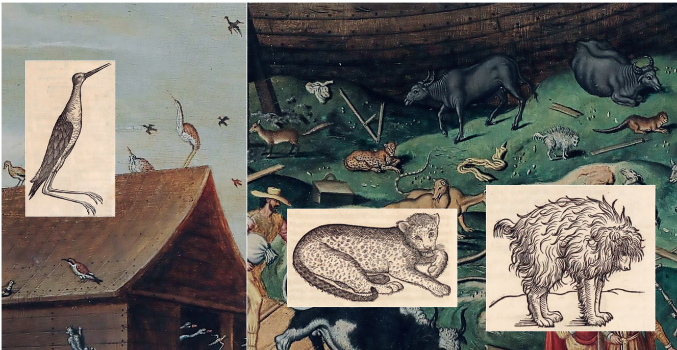
Figura 3. Detalhes da “Arca de Noé sobre o Monte Ararat” de Simon de Myle e as ilustrações do “haematopus”, da “lonza” e do “canis getulus” encontradas nas segundas edições das “Icones Avium” e das “Icones Animalium Quadrupedum” de Conrad Gesner (1560).