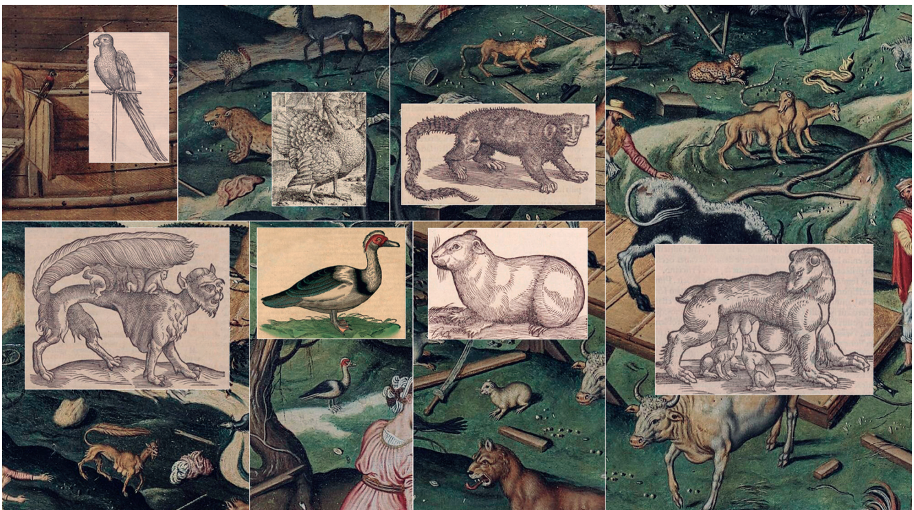
Figura 8. Detalhes da “Arca de Noé sobre o Monte Ararat” de Simon de Myle e ilustrações de animais do Novo Mundo pertencentes às publicações de Conrad Gesner (1551-1560) e Marcus Gheeraerts (1567).