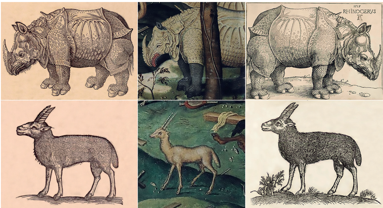
Figura 4. Mamíferos retratados na “Arca de Noé” de Simon de Myle (centro) comparados com as gravuras do “rhinoceros” e do “strepisicheros” existentes nas obras de Conrad Gesner (esquerda) e nos originais de Albrecht Dürer e Pierre Belon (direita).

Índias em Sevilha, providência destinada a estimular sua disseminação 16 . Outros mais devem ter arribado ao longo dos anos, pois tornou-se conhecido na Itália em 1520, na Alemanha em 1530, na França em 1538 e na Inglaterra em 1541 17 . Talvez uma das primeiras imagens de Meleagris gallopavo seja aquela de um indivíduo com