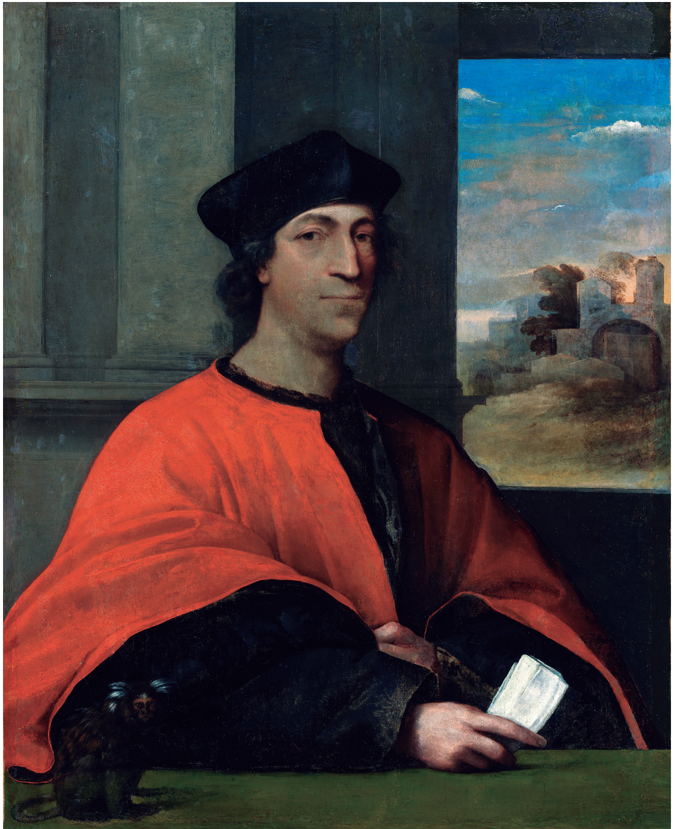
Figura 13. Sagüi ( Callithrix jacchus ) representado no “Retrato do Cardeal Antonio Ciochi del Monte” de Sebastiano del Piombo (ca. 1526). National Gallery of Ireland, Dublin.

poder e ampliar os horizontes das trocas comerciais. Pelo menos nos círculos mais cultivados, entretanto, esse fluxo ininterrupto de novidades terminaria por gerar profundas inquietudes, reforçando indiscretas conjecturas acerca da pluralidade da Criação e dúvidas heréticas sobre a cronologia exposta no Livro Sagrado, criando sérias