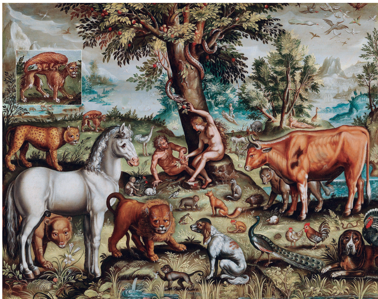
Figura 15. “Adão e Eva no Paraíso”, óleo de autor flamengo desconhecido do século XVII. Oferecido em hasta pública pela Dorotheum, Viena, a 17 de outubro de 2017.