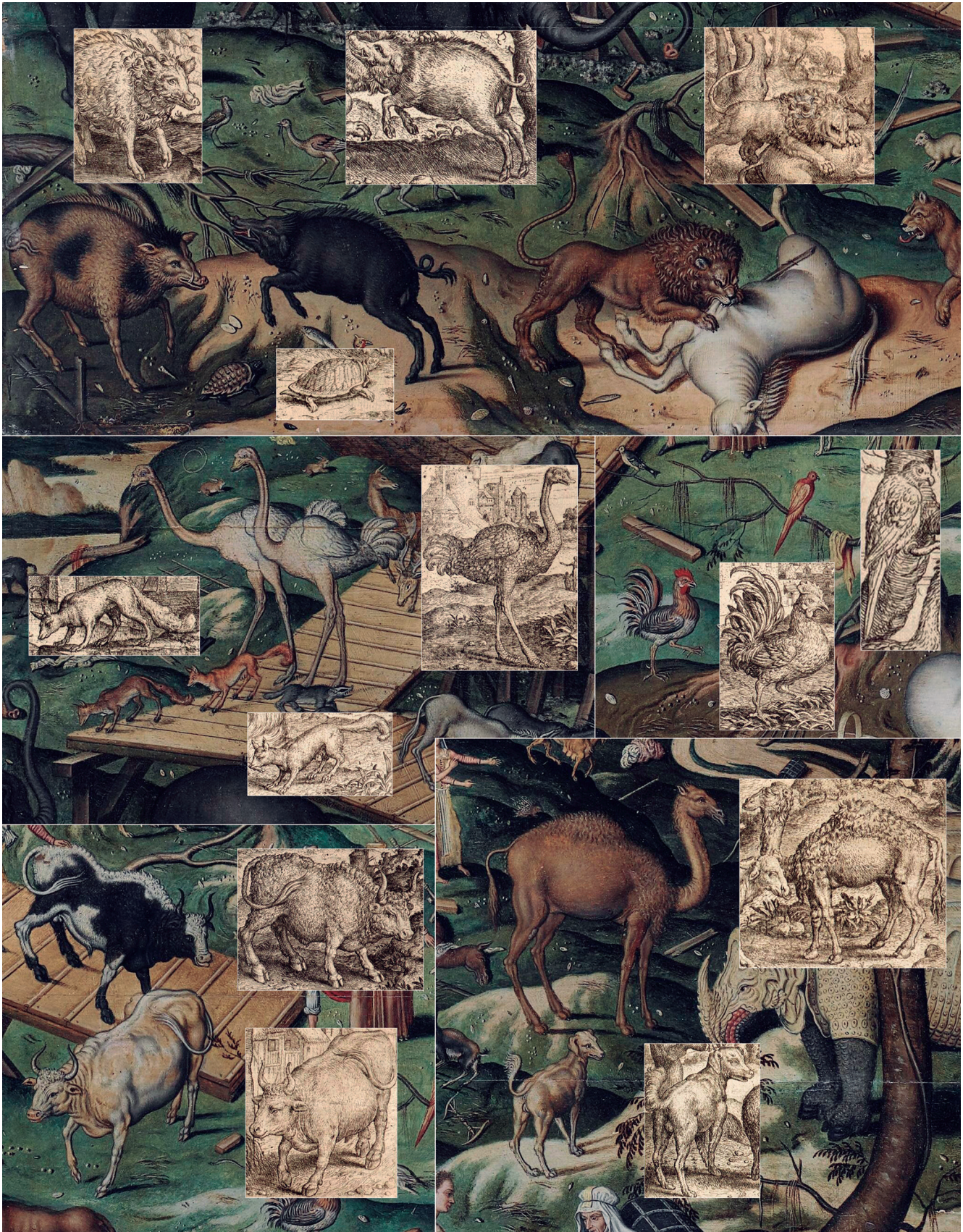
Figura 5. Detalhes da “Arca de Noé sobre o Monte Ararat” de Simon de Myle e algumas das ilustrações de Marcus Gheeraerts pertencentes à “Warachtighe Fabulen der Dieren” (1567).

– de maneira bastante vaga – a crescente presença dos exuberantes psitácidas escarlates trazidos das Américas. Com efeito, aves desse tipo já podem ser vistas em pinturas do início do século XVI, caso do célebre díptico de