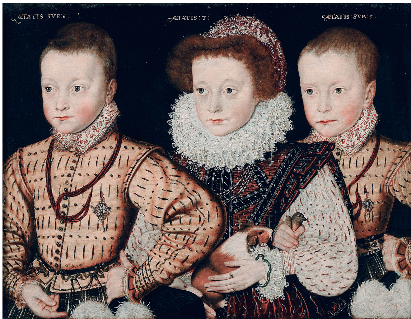
Figura 12. Porquinho-da-índia ( Cavia porcellus ) representado nas “Três Crianças Elisabetanas” de autor desconhecido (ca. 1580). Coleção privada.

suas “ simivulpas ” apresentam a notável peculiaridade de ostentarem longas caudas muito próximas daquelas observadas nos autênticos gambás, discrepância curiosa capaz de ser entendida tanto como uma inesperada licença artística quanto uma surpreendente correção fundamentada em alguma fonte ignota 45 . Com efeito, acredita-se que a estampa mais precisa de um Didelphis só viria à luz no século XVII através da “ Historia Naturae ” de Juan Eusebio Nieremberg (1635).