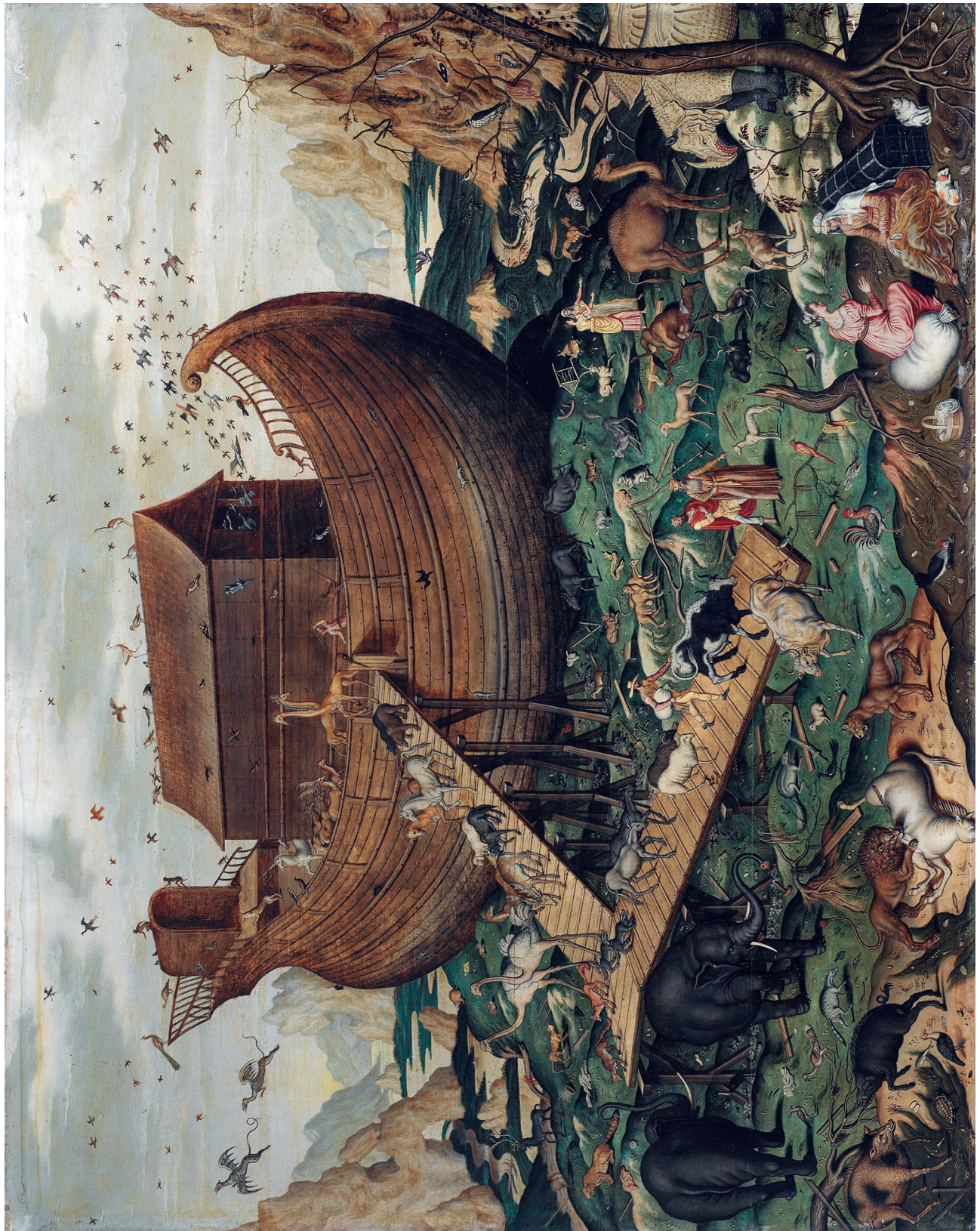
Figura 1. A "Arca de Noé sobre o Monte Ararat" de Simon de Myle (1570). Coleção privada.