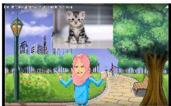
Gambar 1. Potongan gambar dari video animasi 2D hasil pengembangan

Disamping itu, berdasarkan tahap analisis kebutuhan, beberapa pengajar mengaku para siswanya seringkali gampang teralihkan perhatiannya pada saat proses belajar mengajar, sehingga para peneliti memutuskan untuk mengembangkan video animasi 2D yang berdurasi tidak terlalu lama. Terkait topik atau konten materi dalam bahan ajar ini dipilih dengan pertimbangan berdasarkan dari analisis kebutuhan, minat siswa dan silabus yang berlaku, dengan tujuan untuk memberikan pengetahuan baru yang diharapkan dapat bermanfaat bagi kegiatan sehari-hari para siswa, sehingga para siswa dapat merasa nyaman dengan proses pembelajaran yang terasa lebih natural tanpa harus dibebani dengan hal-hal yang tidak perlu.