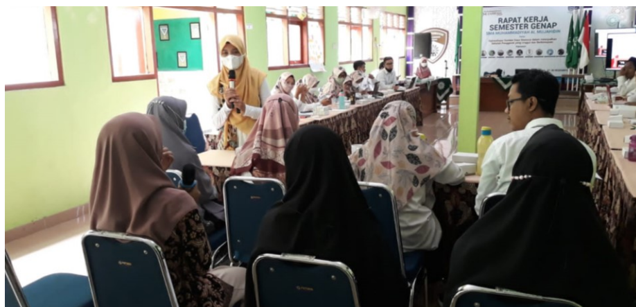
Gambar 3. Pengabdian memberikan materi kepada guru di SMA Muhammadiyah Al Mujahidin

Pelaksanaan pengabdian dilakukan dalam beberapa sesi yaitu penyampaian materi dan praktik pengoreksian dan penilaian modul proyek penguatan profil pelajar pancasila. Penyampaian materi dilakukan dengan memberikan materi presentasi kepada peserta dan dilanjutkan dengan sesi tanya jawab. Adapaun materi-materi yang disampaikan yaitu berkaitan dengan filosofi pendidikan yang merupakan muatan dari pemikiran pendidikan oleh Ki Hadjar Dewantara, pengertian profil pelajar pancasila, dimensi profil pelajar pancasila, tujuan adanya proyek penguatan profil pelajar pancasila, tema proyek penguatan profil pelajar pancasila, cara menentukan tema proyek di sekolah, alur pemilihan dimensi, elemen dan sub-elemen, peran asesmen diagnostic, formatif, dan sumatif. Berikut gambar materi yang disajikan pada saat pelaksanaan pengabdian.