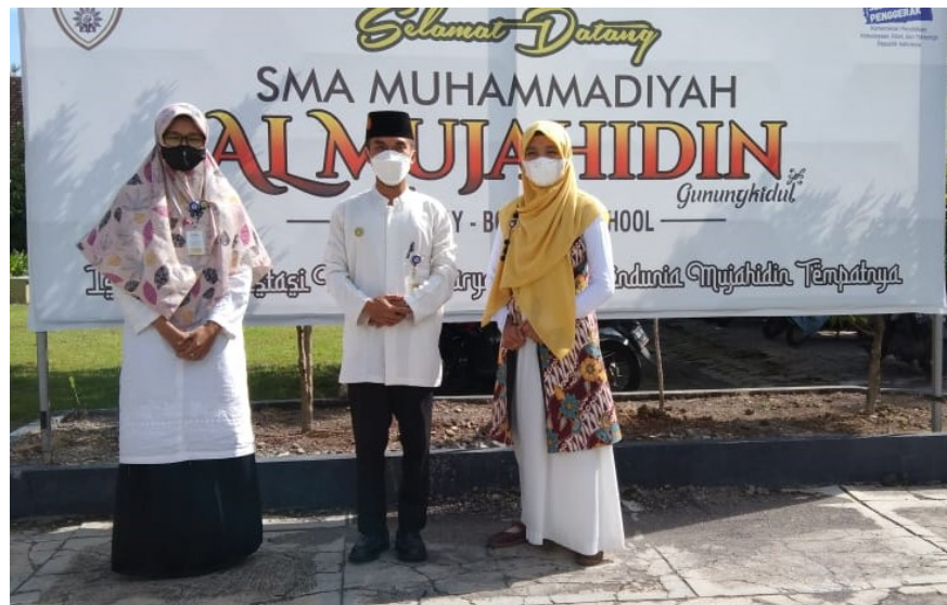
Gambar 2. Tim pengabdian berfoto bersama dengan kepala Sekolah

Pertemuan dengan guru-guru di SMA Muhammadiyah Al Mujahidin dilaksanakan pada pukul 13.00 - 14.45 WIB di ruang aula SMA Muhammadiyah yang dihadiri oleh 27 orang guru dari berbagai mata pelajaran, yaitu ISMUBA, PAI, Bahasa Arab, Matematika, Bahasa Jawa, TOEFL, Bahasa Inggris, Musyrif, dan Musyrifah, Bahasa Indonesia, Kewirausahaan, PJOK, Akuntansi, Ekonomi, Geografi, Sosiologi, serta Kepala sekolah juga turut serta hadir dalam kegiatan tersebut.