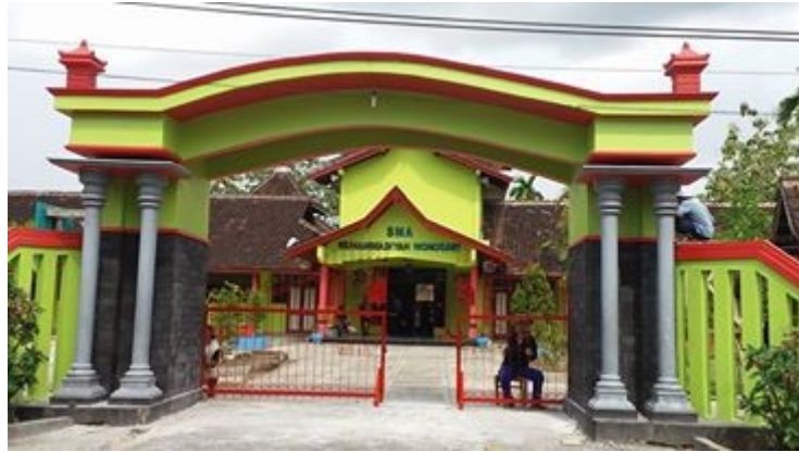
Gambar 1. Gerbang sekolah SMA Muhammadiyah Al Mujahidin