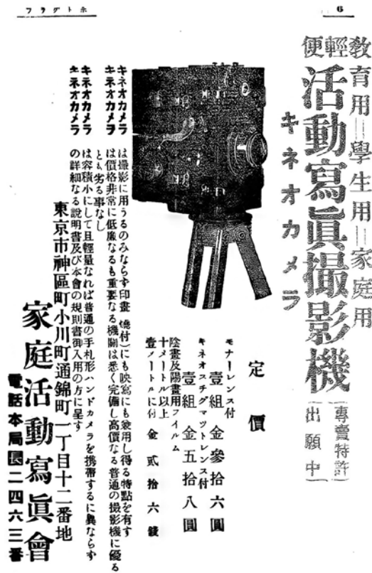
図版 1 キネオカメラの販売広告。『ホトグラフ』1911年9月13号より

もちろん、映画にまつわる現象のすべてを記録し保存することは、不可能だし、無意味ですらあると私は思う。キネオカメラは、多くの人々に普及したわけではなかったし、残された文章記録もきわめてすくない。その後の映画状況にあたえた影響と、のこされた文献・フィルムの量の少なさ、この2つがキネオカメラは映画史として語るにあたいしないという判断を裏づけて今日にいたっている。語るにあたいしないものは忘れられ、映像も、文献資料ものこらない、といった発想だろう。私も、2012年に、稲垣書店の中山信行から先述の冊子『誰にでも出来る活動写真撮影術』を提供されたことをキッカケに、曾根春翠堂の子孫の方々を訪ね歩くなどの取材を進めなければ、キネオカメラの全体像を知ることがなかった (6) 。