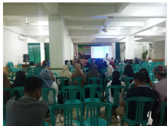
Gambar 1. Dokumentasi Kegiatan Pengabdian

Penulis akan menghindari plagiarisme dengan memparafrasekan pernyataan yang dikutip. Parafrase dapat digunakan dalam berbagai konteks. Banyak faktor yang mempengaruhi parafrase, termasuk panjang ujaran, tingkat diksi, dan register ucapan. Plagiarisme adalah pelanggaran akademik, oleh karena itu sangat penting. Namun, sebagian besar mahasiswa tidak menyadari bahwa kutipan langsung dilarang (Hafidz & Sudarso, 2020). Akibatnya, menggunakan perangkat lunak parafrase adalah kegiatan yang signifikan untuk mengurangi jumlah plagiarisme dalam tesis mahasiswa. Latihan-latihan yang tercantum di bawah ini dirancang untuk mengajarkan mahasiswa bagaimana memparafrasekan materi ilmiah untuk menghindari plagiarisme.