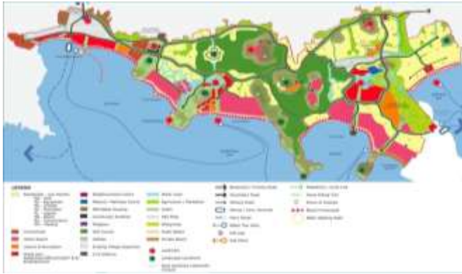
Gambar 3. Peta Pengembangan KEK Mandalika

Masyarakat Sasak kemudian mengenang Putri Mandalika dengan mengadakan ritual Bau Nyale (menangkap Nyale) yang dilangsungkan di beberapa tempat di pantai selatan dan berpusat di pantai Seger (berada di wilayah KEK Mandalika).