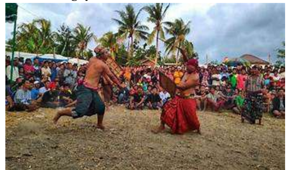
Gambar 9. Tradisi Peresean

Peresean atau perisean adalah pertarungan antara dua lelaki yang bersenjatakan tongkat rotan (penjalim) dan berperisai kulit kerbau yang tebal dan keras (perisai disebut ende). Tradisi ini dilakukan oleh masyarakat suku Sasak, Lombok dan peresean ini termasuk dalam seni tari daerah Lombok. Peresean ini dimulai sejak abad ke-13, mulanya tradisi ini bertujuan untuk memanggil hujan pada musim kemarau. Namun, Peresean telah berkembang menjadi seni ketangkasan seiring berkembangnya zaman.