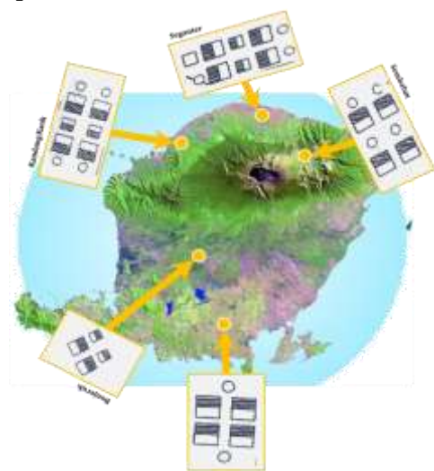
Gambar 5. Pola Bermukim Suku Sasak Sumber. [8]

Dalam sistem kepercayaan Sasak, Rinjani merupakan pusat bumi dan sekaligus pasak bumi dengan berbagai kekuatan kosmologi yang dimilikinya. Dalam sistem tata ruang, pandangan kosmologis ini terekspresi dalam pengembangan ruang fungsional atau ruang artifisial dari lingkungan rumah, sampai tata ruang wilayah tertentu. posisi Gunung Rinjani di kawasan utara Pulau Lombok, sehingga orientasi mata angin utama masyarakat Sasak dalam memahami dan merancang ruang artifisial adalah utara dan selatan. Hal tersebut dapat dilihat pada Gambar 5 berikut: