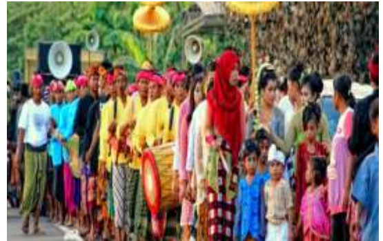
Gambar 11. Tradisi Nyongkolan

Nyongkolan adalah sebuah kegiatan adat yang menyertai rangkaian acara dalam prosesi perkawinan pada suku sasak di Lombok Nusa Tenggara Barat, kegiatan ini berupa arak-arakan, kedua mempelai dari rumah mempelai pria ke rumah mempelai wanita, dengan diiringi keluarga dan kerabat mempelai pria, dan memakai baju adat. Upacara nyongkolan biasanya diikuti oleh banyak orang, dan pasangan pengantin yang diarak diperlakukan seperti seorang raja dan ratu yang berjalan diiringkan oleh para pengawal, prajurit dan dayang-dayangnya. Oleh karena itulah pengantin sering pula disebut raja sejelo yang artinya raja sehari. Ada kebiasaan yang berlaku dalam masyarakat, yaitu bahwa jika seseorang menolak untuk ikut sebagai pengiring dalam acara nyongkolan, maka jika suatu saat orang tersebut mengadakan acara nyongkolan, akan banyak pula orang yang akan menolak untuk mengiringinya.