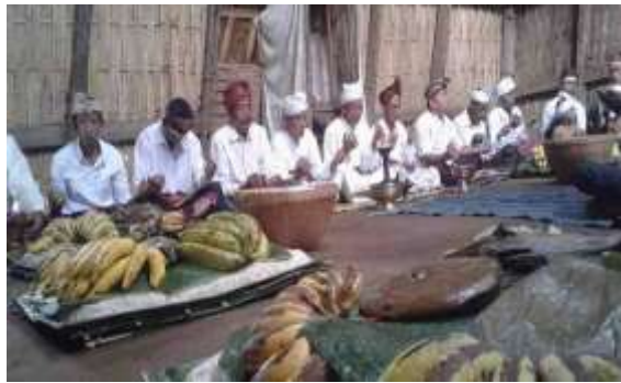
Gambar 12. Tradisi Maulid

2) Tradisi Lebaran Ketupat Masyarakat Lombok biasanya merayakan lebaran ketupat dengan jalan-jalan ke destinasi wisata, ziarah makam, atau berkumpul dengan keluarga. Tradisi Lebaran Topat atau di lingkungan masyarakat Sasak disebut sebagai Lebaran Nine dilakukan setelah menjalani puasa sunah selama enam hari di bulan Syawal.