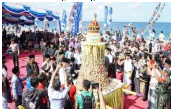
Gambar 13. Tradisi Lebaran Ketupat

Tradisi ini sudah dilakukan secara turun temurun. Lebaran topat juga bisa dilaksanakan setelah menunaikan puasa sunnah Syawal selama enam hari berturut-turut. Masyarakat Lombok mengenal tradisi ini dengan sebutan lebaran kedua. Dalam tradisi ini, masyarakat melakukan serangkaian agenda.