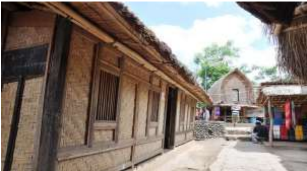
Gambar 7. Bentuk Bangunan Rumah Adat Sade

Dalam konteks tata ruang dan fungsi sosial, konsep rumah Sasak adalah kompleks yang terdiri dari rumah, dapur, lumbung, dan beruqaq . Keberadaan beruqaq berfungsi sebagai ruang publik, lumbung untuk ruang produktif. Axis bangunan tetap mengikuti poros Gunung Rinjani [10]