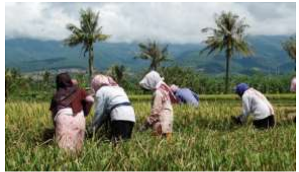
Gambar 8. Mata Pencaharian Mayoritas Sebagai Petani