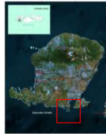
Gambar 1. Peta Pulau Lombok Provinsi NTB

KEK Mandalika terletak di bagian Selatan Pulau Lombok. KEK Mandalika ditetapkan melalui Peraturan Pemerintah Nomor 52 Tahun 2014 untuk menjadi KEK Pariwisata. Dengan luas area sebesar 1.035,67 Ha dan menghadap Samudera Hindia. KEK Mandalika diharapkan dapat mengakselerasi sektor pariwisata Provinsi Nusa Tenggara Barat yang sangat potensial. Keberadaan KEK Mandalika di Pulau Lombok dapat dilihat pada Gambar 1 berikut: