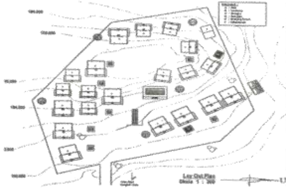
Gambar 6. Pola Bermukim Desa Adat Sade Sumber. [9]

Dalam konsep bermukim, pemilihan lokasi permukiman pun masih mengandalkan faktor kepercayaan kosmos. Hal tersebut dapat dilihat pada Gambar 9 berikut: