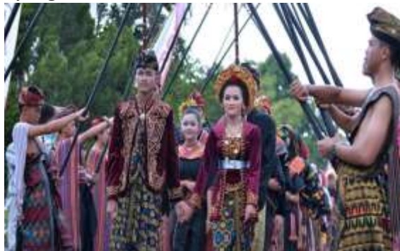
Gambar 10. Tradisi Merariq