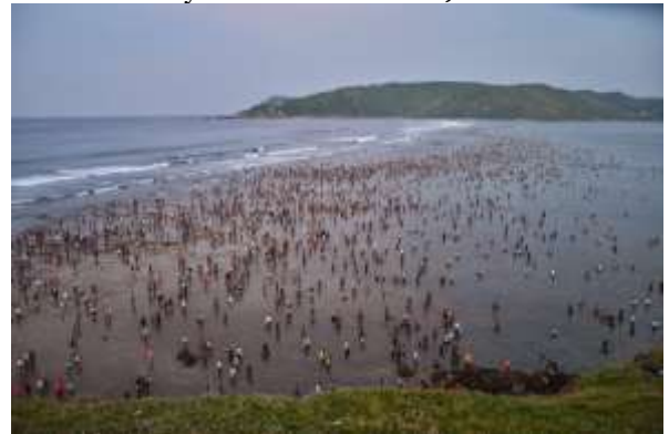
Gambar 4. Festival Bau Nyale