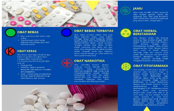
Gambar 3. Pamflet Penggolongan Obat sebagai Acuan Dalam Swamedikasi

Beberapa hal penting yang perlu diperhatikan dalam swamedikasi adalah pengetahuan dalam memahami gejala awal suatu penyakit. Hal ini juga diberikan penjelasan tersebut kepada peserta pengabdian kepada masyarakat. Jika terdapat diagnosis yang tidak sesuai, pengobatan yang berlebihan, indikasi penyakit yang tidak diberikan pengobatan, tidak dapat dilakukannya monitoring terapi, kehilangan kesempatan untuk konsultasi antara dokter dan pasien, berkurangnya peran dan pendapatan sarana pelayanan kesehatan, serta dapat menimbulkan adanya konflik kepentingan antara bisnis dan etika profesi. Pengetahuan tentang tingkatan keparahan suatu penyakit juga perlu dimiliki oleh pelaku swamedikasi, terutama ibu. Jika tidak mengetahui seberapa seriusnya atau parahnya suatu penyakit berdasarkan gejala yang ada, hal ini tentu menjadikan pengobatan yang dilakukan terlalu lama dan dapat memperparah gejala atau keluhan yang ada. Sehingga saat konsultasi ke dokter dan dilakukan pemeriksaan menyeluruh dokter harus memberikan obat golongan keras dengan dosis yang lebih tinggi untuk mengatasi penyakit tersebut (Abdulkadir & Thomas, 2019; Suffah, 2017).