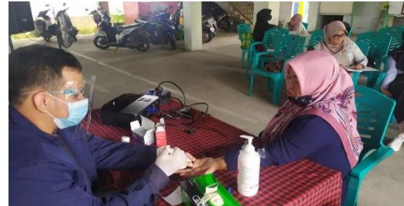
Gambar 4. Aktivitas Pengecekan Gula Darah

mendapatkan nilai gula darah normal dengan angka persentase mencapai 77,7%.