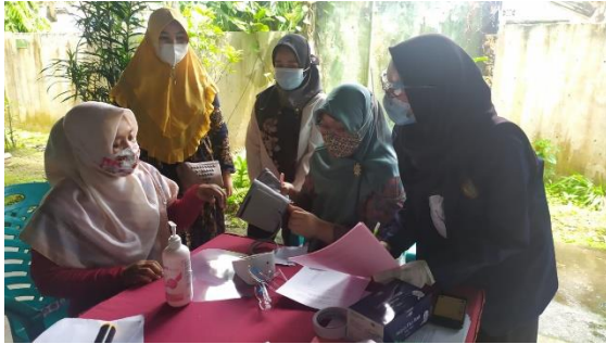
Gambar 6. Aktivitas Pengecekan Tekanan Darah

Kegiatan pengabdian kepada masyarakat ini telah berhasil dilaksanakan. Berdasarkan angket evaluasi kegiatan, peserta penyuluhan merasakan manfaat dari pemberian edukasi swamedikasi di masa pandemi, lebih memahami tahapan penting dalam swamedikasi dan diharapkan akan ada kegiatan serupa secara berkala.