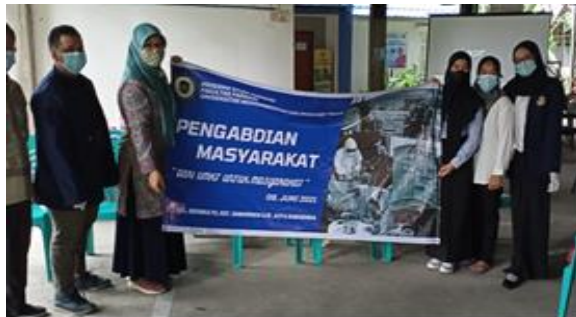
Gambar 1. Foto Bersama Ketua Kelompok Ibu-ibu PKK secara simbolis

Kegiatan penyuluhan dilakukan selama 2 jam dan diikuti sebanyak 30 peserta. Kegiatan dibuka oleh sambutan dan perkenalan ketua kelompok ibu PKK, Kelurahan Sidomulyo (Gambar 1.). Materi penyuluhan yang diberikan berupa presentasi interaktif tentang pengertian swamedikasi, tahapan yang harus dilakukan untuk melakukan swamedikasi yang benar, penggolongan obat paten dan obat herbal yang bisa digunakan dalam swamedikasi. yang disertai sesi tanya jawab oleh peserta penyuluhan (Gambar 2.).