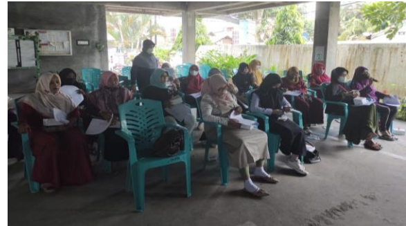
Gambar 2. Peserta Penyuluhan Mengisi Kuesioner dan Mendengarkan Materi Penyuluhan

Penyuluhan ini juga memberikan gambaran apoteker bisa menjadi salah satu alternatif layanan informasi obat, dalam rangka aplikasi swamedikasi. Penyuluhan juga menjelaskan tentang layanan informasi apa saja yang bisa didapatkan masyarakat dari apoteker. Kegiatan tersebut juga bisa menjadi acuan bagi masyarakat ketika bertanya pada apoteker meningkatkan kinerja tercapai efek terapi yang diharapkan serta meminimalkan risiko timbulnya efek samping obat yang tidak diharapkan (Putra et al., 2020).