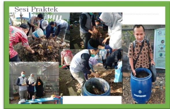
Gambar 3. Sesi Praktek pembuatan kompos

Adapun setelah melakukan workshop online, peserta melakukan praktek langsung yang bukti dokumentasinya dikirim ke youtube. Berikut dokumentasi kegiatan saat sesi praktek.