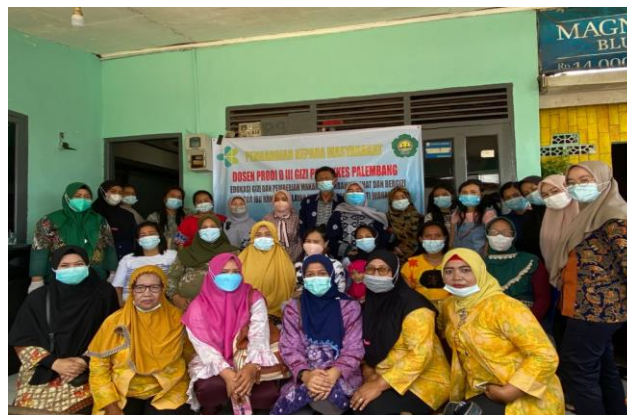
Gambar 5. Seluruh Tim dan Peserta Pengabmas.