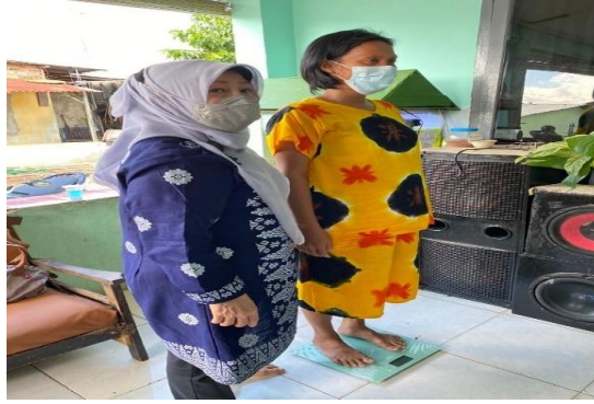
Gambar 3. Penimbangan berat badan ibu hamil.