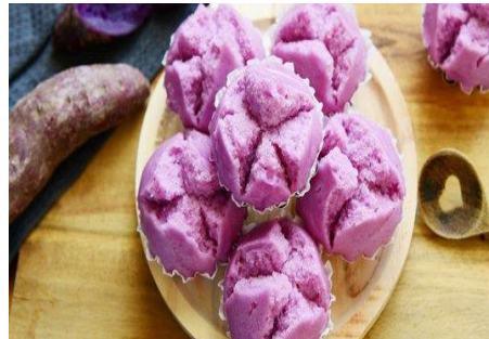
Gambar 4. Contoh 3 (tiga) Macam Makanan Tambahan yang dipraktikkan.