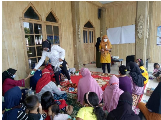
Gambar 1. Penyuluhan Gizi Seimbang Pada Ibu Hamil

Pada gambar 1. Terlihat bahwa Tim Pengabmas sedang melaksanakan kegiatan edukasi gizi seimbang. Seluruh peserta mendapatkan materi mengenai pentingnya makanan tambahan untuk ibu hamil, konsumsi aneka ragam pangan lebihbanyak yang berguna untuk memenuhi kebutuhan energi, protein dan vitamin serta mineral sebagai pemeliharaan, pertumbuhan dan perkembangan janin serta cadangan selama masa menyusui yang meliputi Karbohidrat dan Lemak sebagai sumber zat tenaga, Protein sebagai sumber zat pembangun, Mineral sebagai zat pengatur dapat diperoleh dari buah-buahan dan