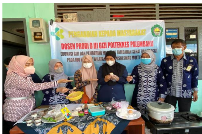
Gambar 2. Pelatihan Pembuatan Makanan Tambahan

Kegiatan Pengabdian Kepada Masyarakat oleh Dosen Prodi DIII Gizi Palembang ini diadakan di wilayah kerja Puskesmas Multi Wahana Palembang pada tanggal 17 September 2021 melalui tatap muka dimulai dari pukul 08.00 sampai dengan 12.00 WIB berjalan dengan protokol kesehatan yang sudah sesuai, tertib, dan lancar dengan jumlah peserta 25 orang.