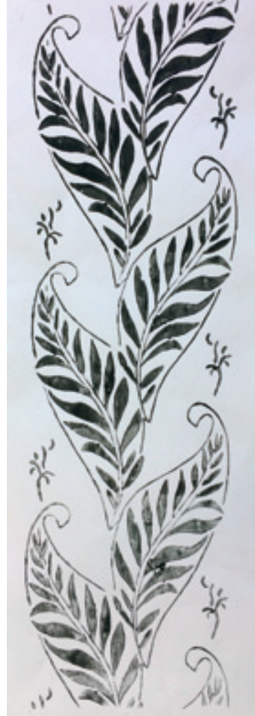
Abb. 2: Das Stempel- motiv

Die Schülerinnen und Schüler empfanden das Thema am Anfang als sehr schwierig und hatten nicht – wie oft bei anderen Themenstellungen – gleich eine Idee dazu im Kopf. Doch als nach einigem Nachdenken die ersten Jugendlichen ihre Ideen aufs Papier brachten und teilweise auch den anderen mitteilten,