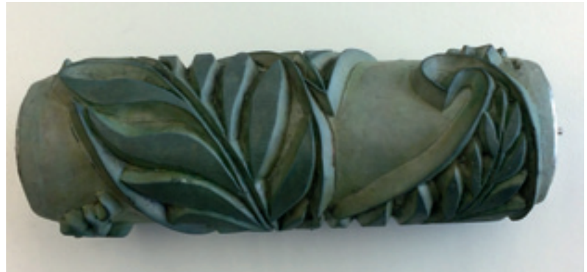
Abb. 1: Der historische Rollstempel

ums des Bezirks Oberpfalz in Neusath-Perschen, den die Klassen – was doch außergewöhnlich ist – nicht nur anschauen, sondern auch für ihre künstlerische Arbeit benutzen, also zum Drucken verwenden durften. Diese Rollstempeltechnik wurde vor ca. 135 Jahren erstmals angewandt. Ihre Blütezeit lag in den 1930er bis 1960er Jahren. Wer Anfang der 1970er Jahre im Malerberuf gearbeitet hat, kennt noch Gestaltungen, die mit Musterwalzen ausgeführt waren, wenn er nicht sogar selbst noch damit gearbeitet hat. Die Motive auf den Rollstempeln änderten sich mit der Zeit und orientierten sich an den Vorlieben der