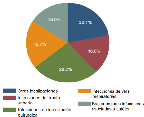
Figura 2. Tipos de IRAS según localización. EP-2019

Las infecciones de localización quirúrgica (ILQ) fueron las IRAS más frecuentes (26,2% del total), seguidas del grupo de infecciones de vías respiratorias-IVR (19,7%). Las ITUs y las bacteriemias e infecciones asociadas a catéter, representaron cada una, el 16%. Figura 2. De las ILQ, más del 50% se asociaron a cirugía NHSN (52,2 %), siendo la cirugía de colon el procedimiento que presentó mayor frecuencia de infección (21,5% de las ILQ de las cirugías NHSN).