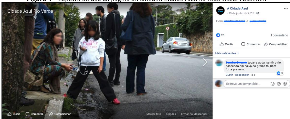
Figura 4 – Captura de tela da página do coletivo Cidade Azul na rede social Facebook

A penetração das tecnologias digitais e em rede nos espaços físicos e a capacidade dessas tecnologias de se incorporarem aos comportamentos das pessoas, constituindo um novo ecossistema midiático e tecnocomunicacional, também se caracteriza pela mobilidade, locatividade e conectividade. Sobre esse assunto, Weiser (1999, p. 3, tradução nossa) já dizia que “As mais profundas tecnologias são aquelas que desaparecem. Elas se entrelaçam na trama da vida cotidiana até que se tornem indistinguíveis dela.”. Pensar com base nessas tecnologias significa, assim, pensar com base nas conexões, associações e entrelaçamentos, a exemplo dos vestígios dos cursos de água visualizados graças às plataformas e dos sentidos que emergem por meio dessas vivências, como observado na imagem seguinte, publicada na página do coletivo Cidade Azul na rede social Facebook durante uma das primeiras ações realizadas pelo grupo, ainda em 2015, na qual uma usuária da plataforma e participante das expedições urbanas compartilha o seguinte: “tocar a água, sentir o rio nascendo embaixo da grama foi bem forte pra mim.” (Figura 4).