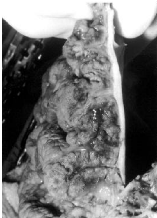
Figura 1. Superfície de corte mostrando acentuado espessamento da parede gástrica com marcada hipertrofia de rugas, que lembram circunvoluções cerebrais.

À abertura da cavidade abdominal foi encontrada ascite de 500 ml, com líquido