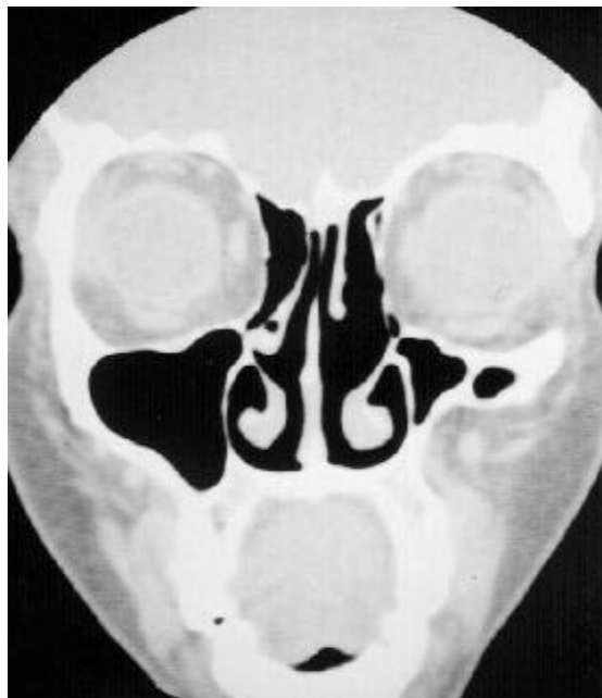
Figura 2B. Tomografia computadorizada: 1 ano de pós-operatório.

septal. Além da abordagem cirúrgica, devem ser associadas medidas que evitem ou pelo menos diminuam a taxa de recorrência (13). Os corticóides tópicos intranasais na forma de spray são muito utilizados após a cirurgia funcional endoscópica para retirada de pólipos da mucosa como forma de diminuir a recorrência, mas são pouco efetivos quando os pólipos têm como comorbidade a SFA. Nestas situações, prefere-se o uso de corticóides sistêmicos pela via oral, pois reduzem a produção de muco e a resposta inflamatória. Recomenda-se o uso de prednisona 0,5 mg/kg/dia nas primeiras 2 semanas, seguindo-se doses em dias alternados por 3 a 6 meses e, após, diminuição gradual para evitar qualquer alteração do eixo hipotálamo-hipófise-adrenal. Os corticóides sistêmicos devem ser reintroduzidos caso haja qualquer sintoma ou sinal radiológico de recidiva. Os antifúngicos sistêmicos não mostram-se efetivos devido à etiologia basicamente inflamatória e alérgica da doença.