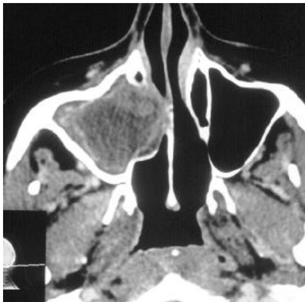
Figura 3. Tomografia computadorizada: axial. Opacificação do seio maxilar direito com destruição de parede óssea. Cultura: Aspergillus sp.

fúngicas encontradas na cultura. Deve-se então submeter o paciente à biópsia da mucosa do seio paranasal, com posterior exame tecidual com coloração por prata, o qual permite a identificação das hifas com maior facilidade (3).