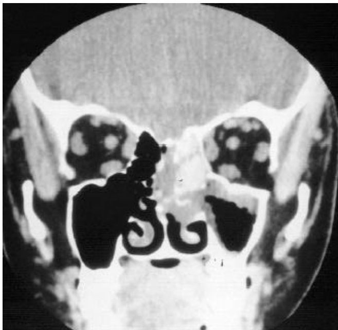
Figura 2A. Tomografia computadorizada: incidência coronal. Opacificação dos seios maxilar e etmoidal esquerdos. Cultura: Trichoderma sp.