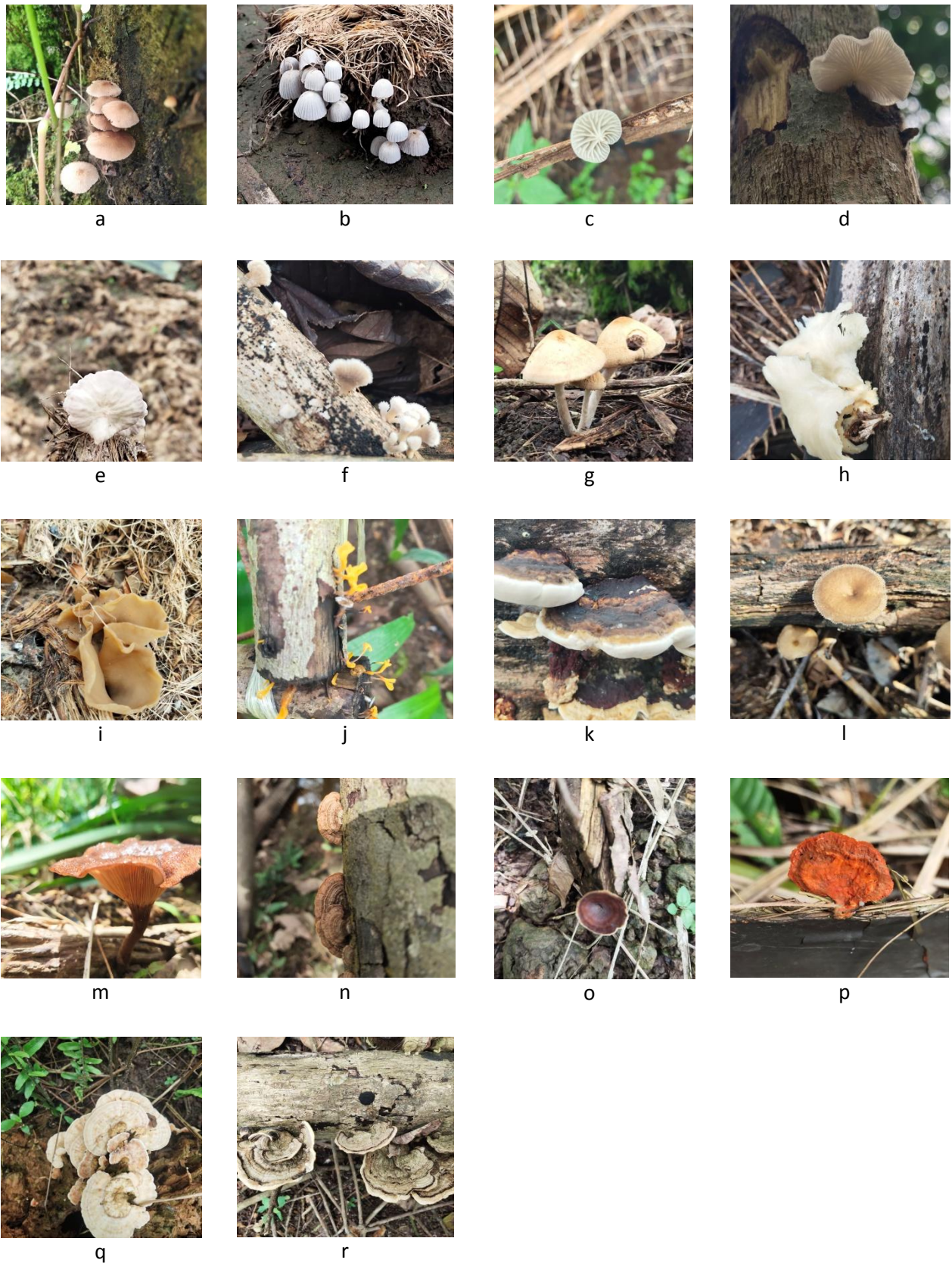
Gambar 2. Jamur makroskopis yang ditemukan di perkebunan kelapa sawit Desa Sebayan, Kecamatan Sambas, Kabupaten Sambas (a) Collybia sp. (b) Coprinus sp. (c) Crepidotus sp., (d) Crepidotus sp. (e) Marasmius sp., (f) Schizophyllum sp., (g) Psathyrella sp., (h) Pleurotus sp., (i) Auricularia sp., (j) Dacryopinax sp., (k) Ganoderma sp., (l) Lentinus sp., (m) Lentinus sp., (n) Hexagonia sp., (o) Microporus sp., (p) Pycnoporus sp., (q) Trametes sp., (r) Stereum sp.