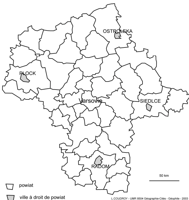
Carte 3 La Mazovie et ses powiat depuis 1998