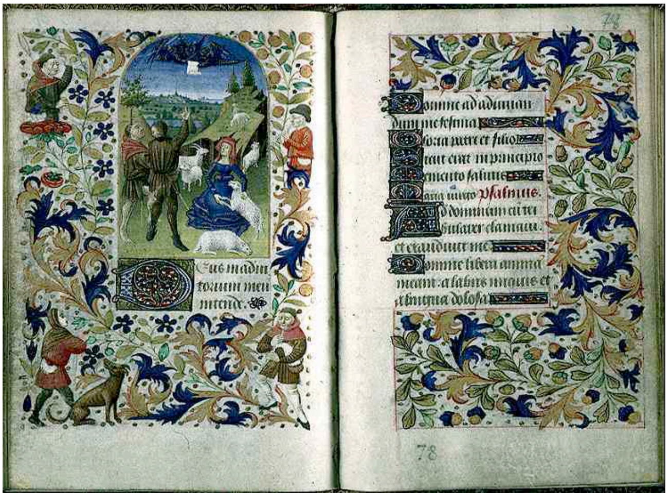
BM Lyon, ms 6022, livre d'heures, 1450-1460. F. 77 v - 78 : petit office de la Vierge, Annonce aux bergers et début de tierce.

Durant le Moyen Age tardif et encore au XVI e siècle, spécialement en France, en Flandre et dans les Pays-Bas, le livre d'heures a connu une telle diffusion qu'il a pu être qualifié de best-seller médiéval. A côté des ouvrages les plus luxueux qui ont fait sa renommée, commandités par les princes et les rois, le livre d'heures a été décliné en de multiples exemplaires, de facture excellente ou plus médiocre, qui témoignent de son succès auprès de toutes les catégories aisées de fidèles laïcs. Car, si les plus célèbres répondaient à une commande exclusive de leurs propriétaires, beaucoup, et non les moins beaux, se trouvaient en vente à l'étal des libraires, d'occasion ou neufs, déjà reliés ou en feuillets séparés, dans l'attente d'ajouts personnalisés ou de la somme que le client était prêt à débours 4 .