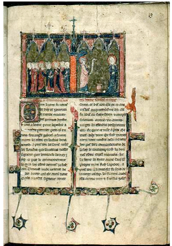
BM Lyon, ms 867, Recueil de vies de saints , fin du XIII e siècle. F. 19 : Mariage de Marie et Joseph, Annonciation.

Toutefois, dans son apparence, le tout est unifié par une écriture aérée et régulière, et une distribution classique sur deux colonnes, le volume mesurant 29,5 X 20,2 cm. L'encre employée est noire, exception faite des passages rubriqués correspondant au début de chaque portion de récit, et aux citations évangéliques ponctuelles laissées en latin. Des encarts historiés sont attachés aux premières lignes rubriquées de chaque section, et ils les suivent ou les précèdent, indifféremment. La sobriété ornementale prime : aucune enluminure en pleine page, les marges sont laissées vides avec leur réglure en évidence. Seuls deux folios ont reçu un décor complet (f. 3 et f. 19). La peinture vient enserrer le texte, le flanque d'une initiale fleurie, le coiffe en haut de page d'une grande enluminure double, et le cerne d'un bandeau à redents qui remonte le long des trois marges. L'ornementation se déploie en appendices végétaux, avec les fleurons couronnant les édifices d'encadrement des miniatures. Des antennes s'épanouissent en volutes denticulées sur les bords externes. Et au sommet des tiges de l'entrecolonne et de la marge de gouttière, l'enlumineur a perché des figures chimériques munies d'instruments de musique.