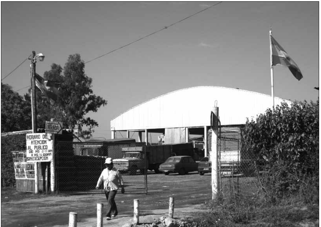
Photo 1 : Le marché de gros de Pilar, un nouveau marché crée par les Boliviens (cl. J. Le Gall – 2008) The Bolivian wholesale market of Pilar

Ces marchés replacent l'agriculteur-paysan au cœur de l'acte commercial, puisqu'il est lui-même le vendeur. À Stockholm, les marchés de vente directe s'appuient sur des règles fermes : le vendeur est obligatoirement le producteur de ce qu'il vend (photo 2). À Buenos Aires, aucune règle n'est fixée mais les Boliviens grossistes en légumes verts sont soit des producteurs, soit des revendeurs s'approvisionnant directement auprès de ces mêmes producteurs. En outre, on voit aussi des