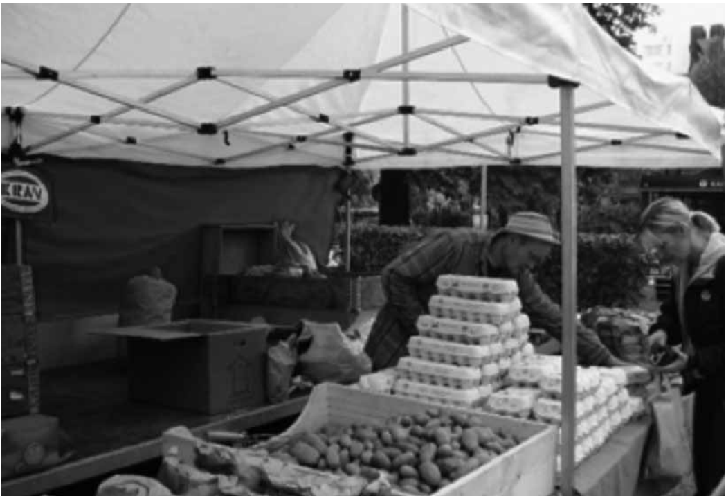
Photo 2 : Les marchés fermiers « Bondens Egen Marknad » à Stockholm Farmers' market « Bondens Egen Marknad » in Stockholm City

À Buenos Aires sont mis en évidence deux types de réseaux : les familles élargies et les associations à l'origine des marchés de gros, apparentées à des coopératives, mais qui sont aussi des lieux de rassemblement de la collectivité (fêtes, tournois sportifs). Les réseaux sociaux ont facilité la connexion des espaces de production aux réseaux de commercialisation et les circulations croissantes des Boliviens au sein de l'Aire métropolitaine. En effet, l'obtention d'un emplacement dans un marché de gros se fait généralement sur information d'un parent proche ou lointain, et