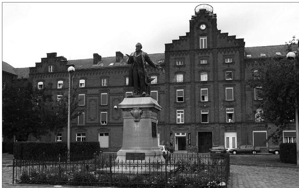
Photo 4 : Le pavillon central du Familistère Godin à Guise (cl. C. Hochedez, juillet 2003) Centerbuilding of the Godin Familistère in Guise

This cow, made out of old metal barrels will stay at the entrance of the village nine months after the "festivache" event is closed.