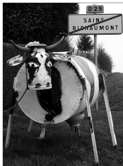
Photo 3 : Vache artistique en plein air (cl. C. Hochedez, février 2004)

– Le projet Utopia entraîne l'opposition farouche de la population locale. Les raisons du blocage semblent assez évidentes. On pourrait arguer que l'opposition se porte sur le refus d'un projet imposé d'en haut, par le Conseil Général. La raison tient plus à l'enjeu social constitutif du projet. En effet, le projet de rendre à ce haut-lieu de l'utopie sociale sa dimension symbolique défend la patrimonialisation du site (photo. 4). Les habitants, retraités de l'usine Godin et veuves d'anciens ouvriers, souvent âgés et de condition modeste, refusent farouchement de quitter leurs logements. Pour eux, le Familistère est un patrimoine immobilier et affectif, alors que pour les concepteurs du projet il représente un patrimoine architectural et un témoin scientifique. Les deux approches s'opposent à tel point qu'on ne parle plus jamais du projet mais de la polémique qu'il suscite avec les habitants du familistère, constitués en association « Pour le droit de continuer à vivre au Palais social ».