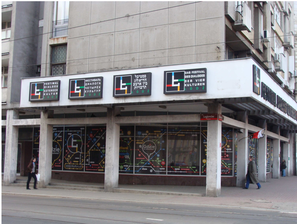
Fig. 2. Le siège du Festival du Dialogue des Quatre Cultures

Cette réalité est incarnée dans le « Festival du dialogue des quatre cultures 4 » qui célèbre chaque année depuis 2002 la création artistique juive (via des artistes venus d'Israël ou d'autres pays), polonaise, russe et allemande, à travers des spectacles vivants et des expositions (figure 2). De même, un des projets urbanistiques du centre-ville propose l'ouverture de quatre nouvelles rues, elles aussi au nom de ces cultures 5 . Mais l'articulation entre revitalisation de friches urbaines et promotion de Łódź comme ville de culture s'est concentrée du côté de la gare principale de la ville.