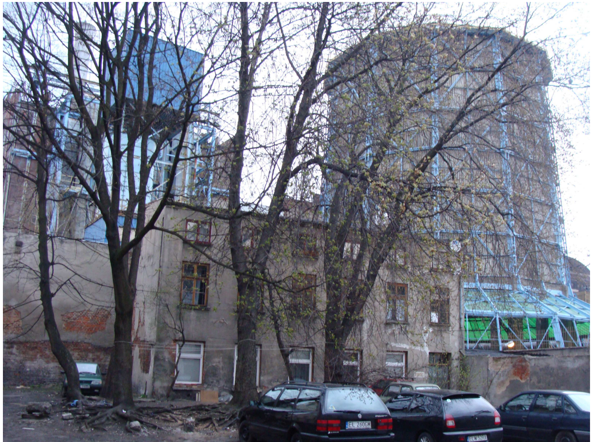
Fig. 3. La tour de l'EC 1

comprend une « zone artistique et culturelle spéciale » 13 , un centre de festivals et de congrès, un musée scientifique, des studios de sons et d'image, etc. (figures 1 et 3).