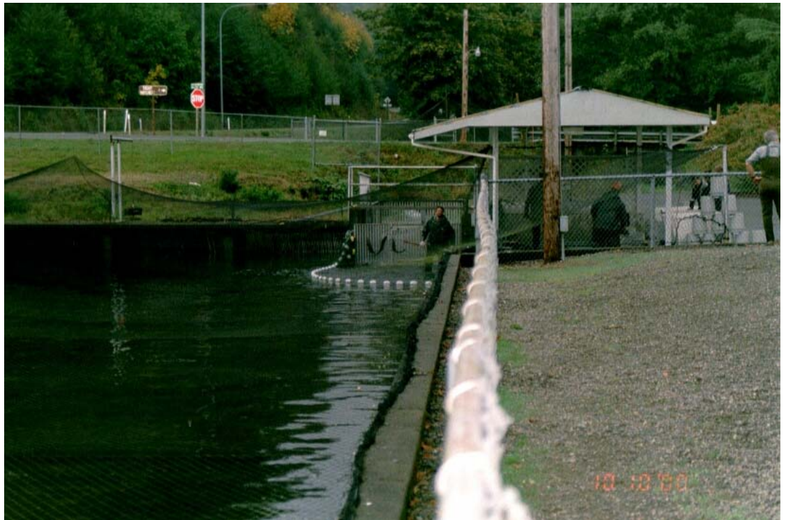
Kuva 2. George Adams -kalanviljelylaitoksen keinoallas, johon laitoksesta istutetut poikaset nousevat aikuisina kutukaloina. Kalat on nuotattu lypsykatoksen viereen.

Aamupäivällä vierailimme George Adams Hatcheryssä, n. 30 km luoteeseen Olympiasta, Sheltonin kaupungin lähellä. Kyseessä oli tavanomainen, suomalaisittain pienen näköinen viljelylaitos, jossa viljeltiin lähinnä kuningaslohta. Noin 4 miljoonasta laitoksesta istutetusta n. 100 päivää vanhasta poikasesta saatiin vuosittain 2000–3000 emokalaa, jotka kotiutuivat ällistytävän tarkasti takaisin laitokselle lypsettäväksi (kuva 2).