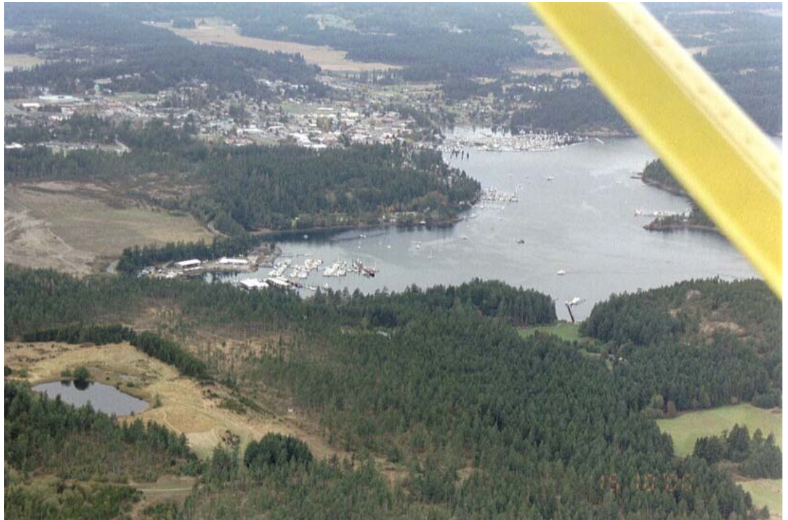
Kuva 13. Laskeutuminen Shaw Islandille alkaa.

Shaw Islandilla sijaitsee suurin osa NMT:n tuotantotiloista, mihin vierailumme suuntautui. Valokuvaaminen oli valitettavasti kiellettyä täällä. Ensimmäinen verstaas oli tehty autotalliin ja se oli edelleen käytössä. Paikka oli täynnään metallien työstämiseen soveltuva koneita. Jefferts kertoi, että NMT on valmistanut kaikki tuotteensa sekä tuotteiden valmistamiseen tarvittavat laitteet alusta pitäen itse. Saimme esimerkiksi nähdä laitteen, jolla on valmistettu binäärisesti koodattua kuonumerkintälankaa 1970-luvulta lähtien. Se oli kokonaan Jeffertsin omaa käsityötä. Nykyään NMT valmistaa enää prototyypit itse, mutta käyttää sen jälkeen alihankkijoita elektronisten komponenttien toimituksiin. Kaikki laitteet kootaan ja testataan Shaw Islandilla. Uusien desimaalisesti koodattujen kuonumerkintälankojen valmistukseen käytettiin laser-polttoa (1,1 mm paksuiseen teräslankaan kirjoitetaan mikroskooppisen pieniä numeroita). Meille esiteltiin myös aivan uusia tieto varastoivia merkkejä. Ne mittasivat päivän pituutta sekä veden lämpötilaa ja syvyyttä. Tuntemalla tarkasti ajanhetki, voidaan päivän auringon lasku- ja nousuaikojen perusteella laskea sekä pituus- että leveyspiiri, jota voidaan vielä tarkentaa veden lämpötilan perusteella. Isomman (pituus n. 8 cm) merkin käyttöaika oli 7 vuotta ja pienemmän 2 vuotta. Näitä merkkejä on tähän mennessä käytetty bluefin-tonnikalalle, joiden vaelluksia Tyynessä valtameressä pystyttiin ensimmäistä kertaa seuraamaan pitkän ajan kuluessa.