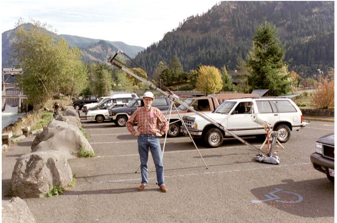
Kuva 18. Columbia-joen alimman voimalaitoksen, Bonneville, alapuolella sammen kalastuksessa käytetty syöttikoukun linkoaja. Lingon tyvellä näkyy valkoinen saavi, johon siima puolattiin kelalta: syötin lähtönopeus on niin suuri, että paksu siima ei purkaudu riittävän nopeasti kelalta!

Lohilajien lisäksi kalateitä käyttävät myös mm. siika, sampi ja nahkiainen. Parhaillaan Bonnevilleen padon alapuolella oli menossa sammen onginta. Sitä harjoitettiin sekä rannalta että alempana joessa veneistä käsin. Rannalta pyytäjät linkosivat syöttikoukun jokeen valtavilla ritsoilla, joiden kantama oli n. 200 metriä. Kalastuksessa käytettiin pitkiä n. 12 jalan vapoja ja järeitä avokeloja.