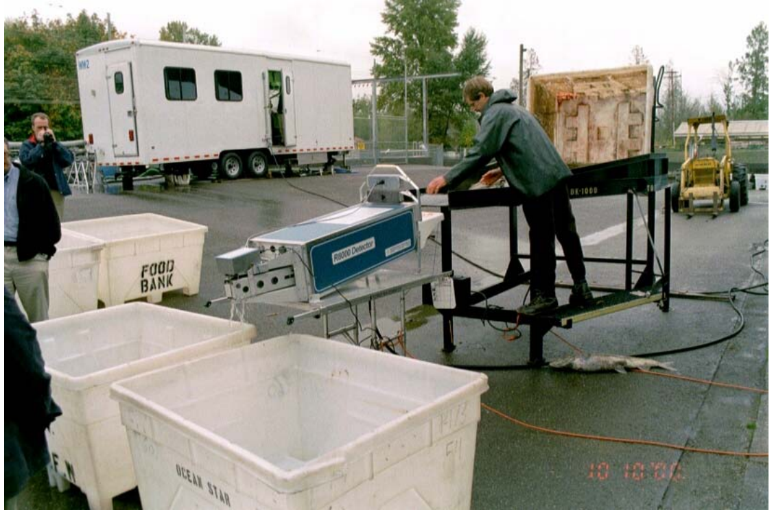
Kuva 3. Kuonumerkkien etsintää kuningaslohista NMTn hihnadetektorilla. Maassa lojuva iso lohi (10–15 kg) ei mahtunut tästä detektorista läpi. Taustalla merkintävaunu, jossa oli käynnissä kuonumerkintä automaattisella kuonumerkintälaitteella.

Laitoksella oli parhaillaan käynnissä kuningaslohen poikasten kuonumerkintä, jota tehtiin NMTn uudella automaattisella kuonumerkintälaitteistolla, joka oli sijoitettu Pohjois-Amerikassa merkinnöissä yleisesti käytettävään merkintävaunuun, traileriin. Vaunussa oli 4 merkintäyksikköä, lajittelija ja niitä ohjaava tietokone valvontamonitoreineen (kuva 4).