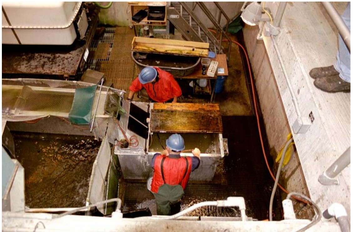
Kuva 16. Bonnevilien kutulohien käsittelylinjan pää, josta kalat päätyvät nukutusaltaaseen. Mittaus- ja merkintävälineistö on takana näkyvällä pöydällä.