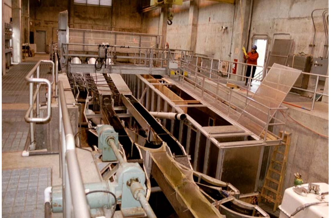
Kuva 15. Yleiskuva Bonnevilien voimalaitoksessa olevasta kutulohien käsittelyyn rakennetusta hallista. Takana näkyvät halliin tulevat kolme käsittelylinjaa, joiden avorännit lajittelijoineen etualalla.