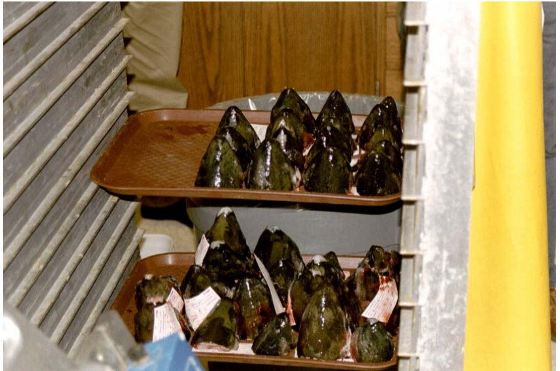
Kuva 5. Lohien päitä valmiina käsiteltäväksi.