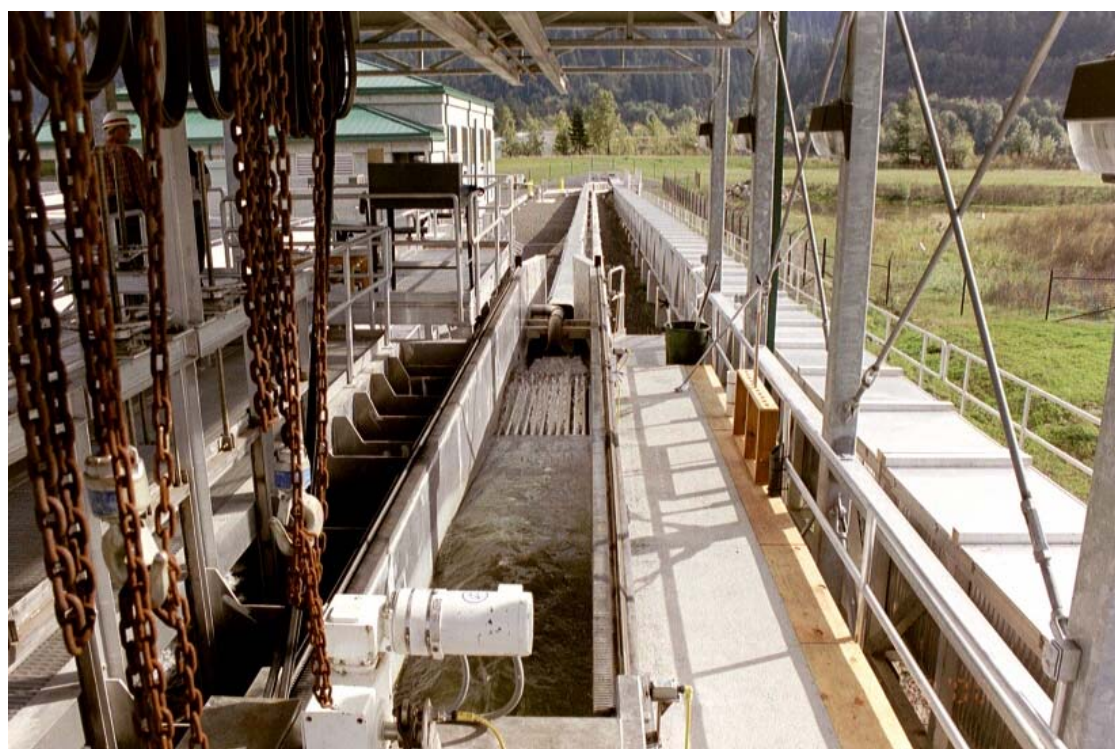
Kuva 17. Alaslaskeutuvien smolttien tutkimusta varten rakennettu kuljetuslinja, joka jatkuu taustalla olevan tutkimusrakennuksen läpi. Poikaset menevät keskellä näkyvän ritilälajittelijan läpi ja putkeen eksyneet suuremmat kalat jatkavat matkaa suoraan eteen päin.

Bonnevillen läpi alaspäin vaeltaa vuosittain 30–50 miljoonaa vaelluspoikasta, joiden kulun turvaamiseksi juoksetetaan vettä tulvaluukuista smolttivaelluksen aikana. Kaasukuplataudin torjumiseksi tulvaluukuista purkautuva vesi nostetaan hyppyrimäisen rakenteen avulla ilmaan, jottei typen ylikyllästymistä pääsisi tapahtumaan. Bonnevillessä oli parhaillaan käynnissä smolttien keräilyyn ja alaskuljettamiseen keskittyvä projekti (1999–2001), jonka kustannukset ovat 62 miljoonaa dollaria eli lähes puoli miljardia markkaa. Turbiinien rakennetta on alettu muuttaa sellaiseksi, että alaspäin vaeltaen kalojen vahingoittuminen olisi mahdollisimman vähäistä. Turbiinien eteen on rakennettu raskastekoiset ohjaimet, joiden avulla voidaan turbiinivirtaan joutuneet vaelluspoikaset ohjata 1,2 m läpimittaiseen noin 3 km pitkään laskukanavaan, joka aukeaa padon alapuolelle. Kanavan alapää ennen avautumista jokeen kulkee tutkimushallin läpi, jossa kaloja voidaan kerätä merkintää, mittauksia yms. toimenpiteitä varten hallin sisällä oleviin altaisiin (kuva 17).