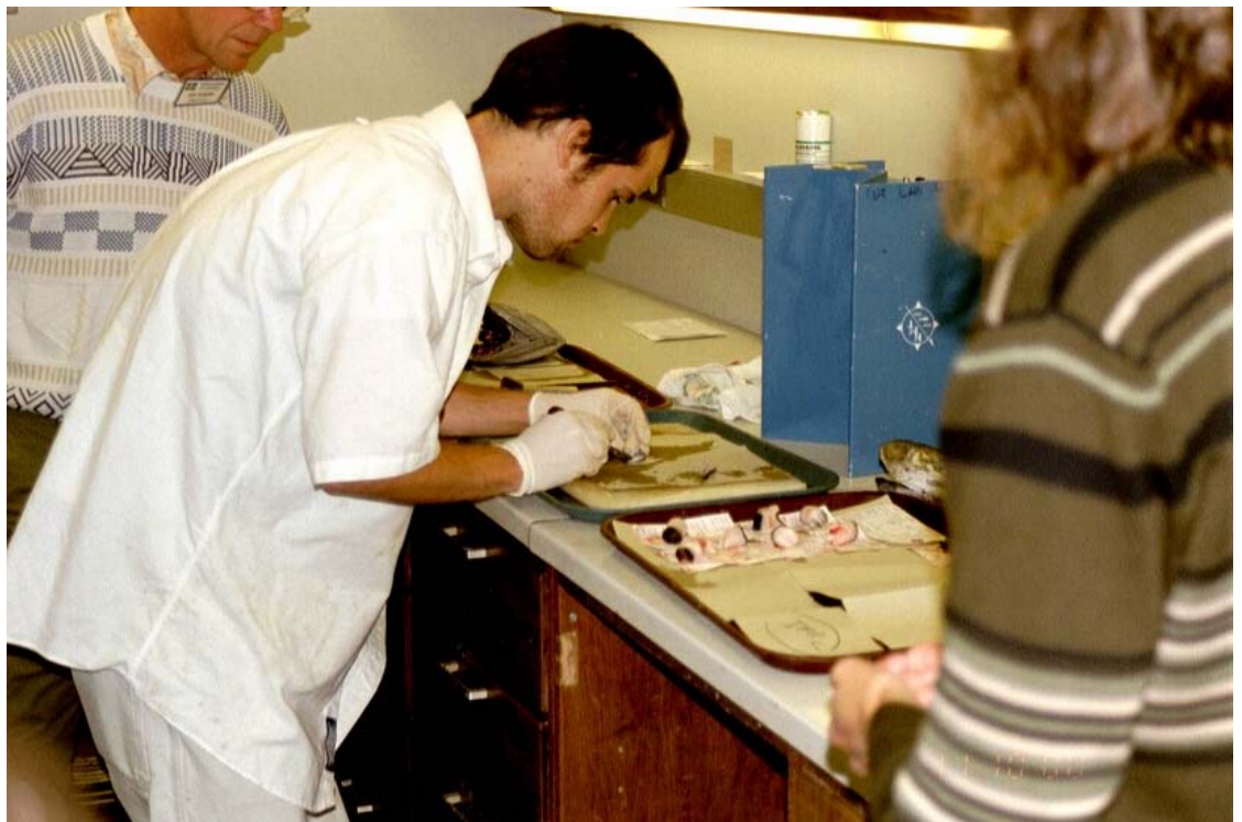
Kuva 6. Kuonumerkki löytyy lopulta lohien päästä. Pöydällä Suomessakin paljon käytetty poytädetektori.