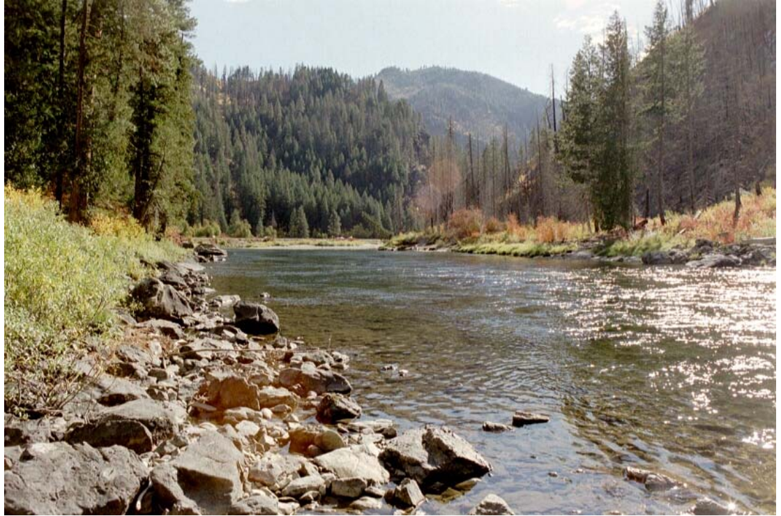
Kuva 10. Maisemia Washingtonin osavaltion vuoristojen nivamaisesta jaksosta.