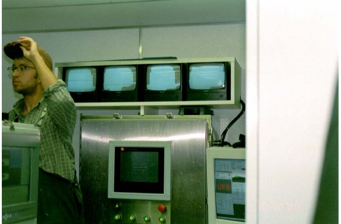
Kuva 4. Automaattisen merkintävaunun valvomo. Ylhäällä eväleikkausrobottien monitorit, alempana itse merkintäprosessista kertovat näytöt.

Merkittävät kalat haavittiin n. 1,5 m korkeudella olevaan altaaseen, josta kalat itse hakeutuivat lajittelijalle laskeutuvaan putkeen. Jokainen kala valokuvattiin, jonka jälkeen tietokone analysoi kuvasta kalan pituuden, jonka perusteella kompuuteri määräsi lajittelijan aukaisemaan tietyn portin. Lajittelija lajitteli erikokoisia kaloja eri merkintäyksiköihin, joista kukin oli säädetty tietyn kokoisille kaloille. Tällä hetkellä voidaan merkitä poikasia, joiden pituus on 62–142 mm. Lajittelijalta kalat tulivat putkea pitkin matalaan, valkoiseen ja yltä avoimeen n. 50 x 50 cm kokoiseen kaukaloon, josta lähti putki merkintäyksikköön. Koska allas ei tarjonnut mitään suojaa, kalat hakeutuivat itse putkeen. Putkessa kukin kala valokuvattiin uudelleen, ja kuva prosessoitiin eväleikkausrobottia varten. Sitten kala liukui pää alaspäin kiinni MKIV-merkintäinjektorin kuonomuottiin, jolloin siihen injektoidiin kuonomerkki ja samalla leikkuri poisti rasvaevän. Valvontamonitoreista voitiin tarkkailla jatkuvasti eväleikkauksen onnistumista. Silmämääräisesti arvioituna leikkaus onnistui erinomaisesti. Tämän jälkeen merkityt kalat poistuivat putkea pitkin ulkoaltaaseen. Vuonna 2000 Washingtonin osavaltiossa automaattisilla merkintävaunuilla eväleikataan/kuonomerkkitään 6,8 miljoonaa lohien poikasta. Yksityiskohtainen kuvaus automaattisesta kuonomerkintäjärjestelmästä löytyy seuraavilta verkkosivuilta: http://www.world-mark.net .