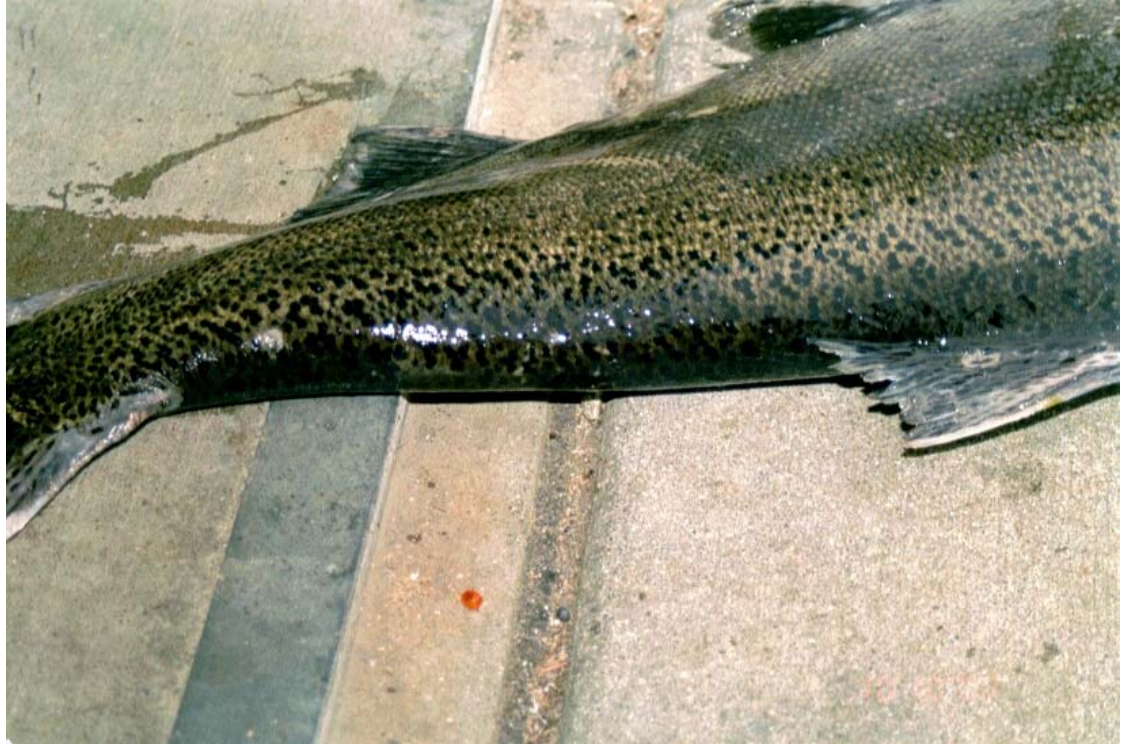
Kuva 8. Kuningaslohen poikasena leikatun rasvaevän leikkaushaava on parantunut täydellisesti, kuin evää ei olisi koskaan ollutkaan.

Edellä kuvattu säätelymalli hyvin todennäköisesti lisää kutevien kalojen nousua elvytysjokiin. Tämä avaisi aivan uusia mahdollisuuksia tutkia elvytysistutusten tuloksellisuutta esimerkiksi kuonomerkinnoin. Jokisaaliiden lisääntyminen tarkoittaisi, että merkkipalautusaineistoa ei välttämättä tarvitsisi kerätä lainkaan merialueelta vaan jokisaaliista, mikä alentaisi kustannuksia merkittävästi. Lisäksi yksittäisellä elvytysjoella tehtävä tutkimus olisi suhteellisen riippumaton muualla tehtävistä töistä, mikä yksinkertaistaisi osatutkimusten toteuttamista.