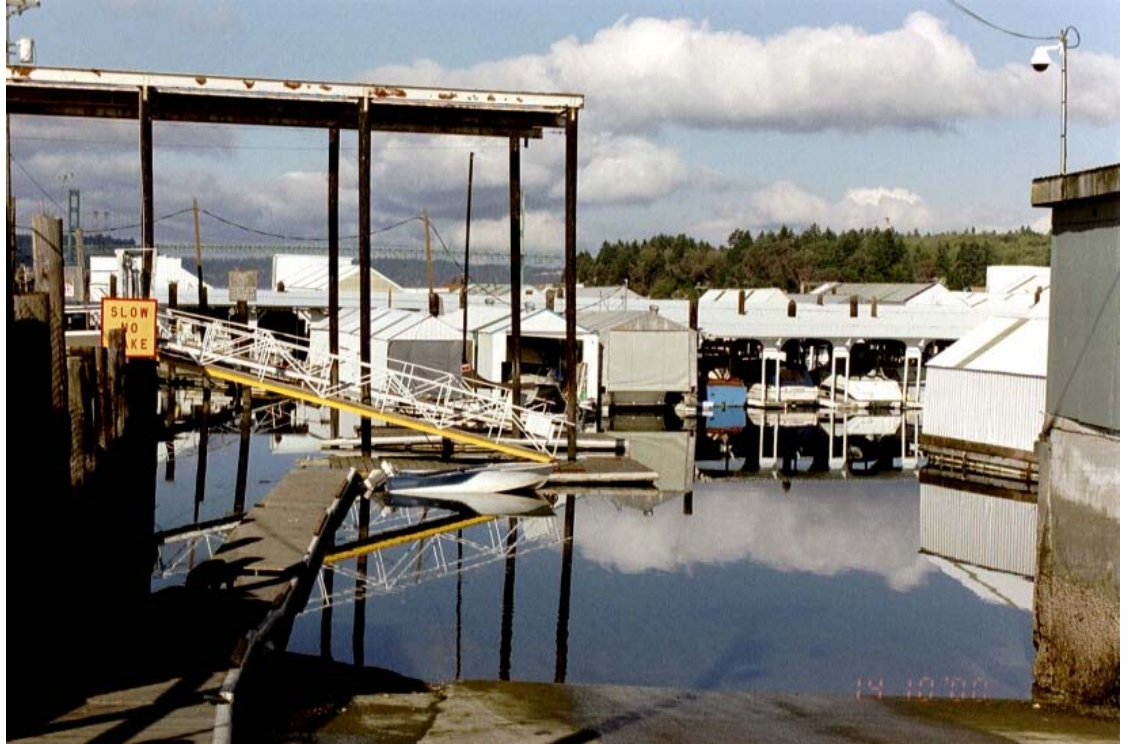
Kuva 11. Tacoman kalasatama.