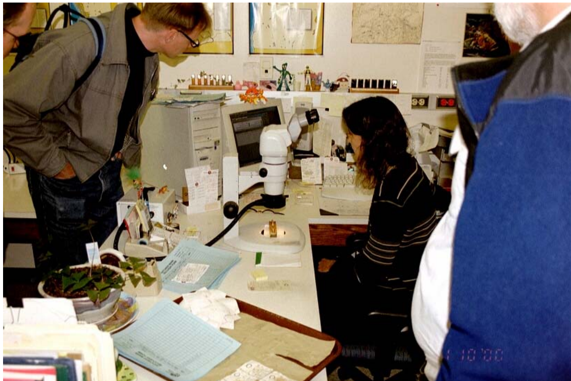
Kuva 7. Kuonomerkki on juuri dekodattu mikroskoopin avulla ja tiedot tallennettu tietokantaan.

Tietojen tallennukseen oli tehty relaatiotietokantasovellus (unix-ympäristöön), joka asiaankuuluvasti informoi tallentajaa koodin takana olevien kalojen lajista yms. taustamuuttujista sekä hälytti olemattomista koodeista (kuva 7). Näytteet tulevat kentältä laboratorioon hyvin nopeasti: viikon kuluttua pyynnistä kunkin kalan tiedot ovat em. tietokannassa. Tämä mahdollistaa Blankenshipin mukaan lähes reaaliaikaisen kalastuksen säätelyn. Massiivisten eväleikkausten takia WDFW on tehostanut kuonomerkityjen kalojen omatoimista keräilyä kalasatamissa ja jokivarsien urheilukalastuspai-koissa.