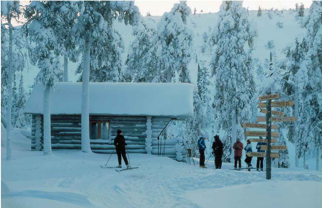
Kuva 1. Hiihtäjiä Pyhätunturin Karhunjuomalammella.

alueille matkat suuntautuvat, ja miten paljon rahaa luontomatkkaan käytetään.