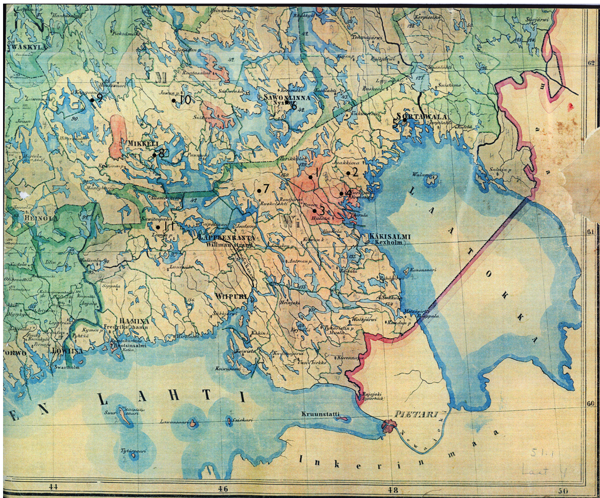
Kuva 1. C.W.Gyldenin metsävarakartan antama kuva Suomen kaakkoisosien metsävaroista. Runsasmetsäisimpien alueiden sijainti on kuvattu tummanvihreällä ja pahiten puupulasta kärsineiden alueiden sijainti tummanpunaisella. Näiden alueiden väliin jäävät vyöhykkeisesti muut metsävaraluokat, jotka on selostettu tarkemmin tekstissä. Artikkelissa mainittujen paikkojen likimääräisiä sijainteja on merkitty karttaan mustilla pisteillä ja numeroilla: 1 = Parikkala, 2 = Jaakkima, 3 = Hiitola, 4 = Kurkijoki, 5 = Sortavala, 6 = Kerimäki, 7 = Ruokolhti, 8 = Anttola, 9 = Kangasniemen Läsäkoski, 10 = Juva ja 11 = Savitaipale. Helsingin yliopiston Viikin tiedekirjaston kokoelmat.

Itä-Suomessa edellä mainittujen luokkien metsät sijoittuivat niin, että runsaimmat, yltäkyläiset metsävarat sijaitsivat alueen itä- ja pohjoisosissa. Venäjän rajaan rajoittuen tällainen kaksiosainen vyöhyke sijaitsi Iломансин, Lieksan ja Nurmeksen kuntien itäosissa. Pielisen länsipuolella, Pohjois-Savon ja Pohjois-Karjalan rajaseuduilla ollut vyöhyke sijaitsi enimmäkseen Juuan ja Nurmeksen kunnissa, mutta se jatkui aina Iisalmen pohjoisosiin kiertäen