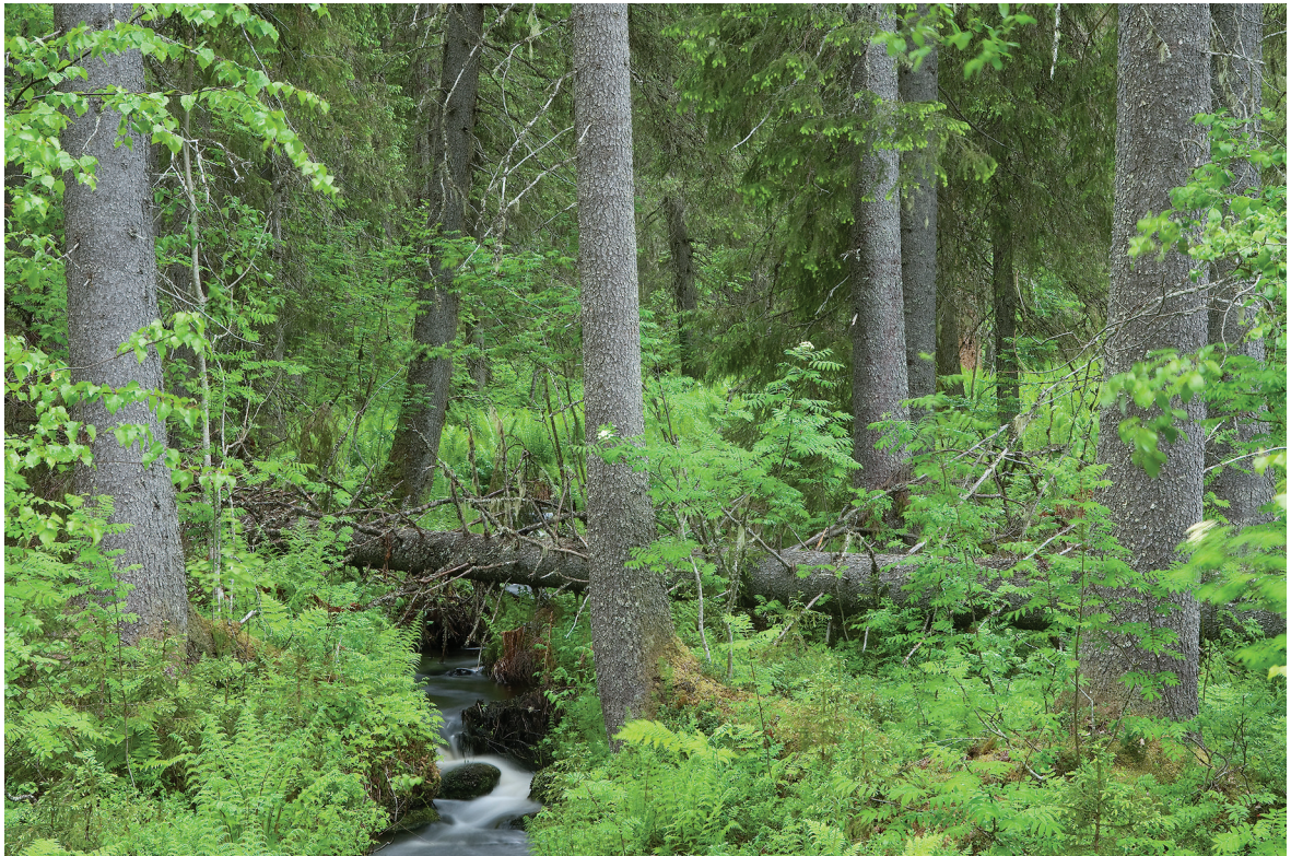
Kuva 1. Rehevät puronvarret ovat sellaisia runsaspuustoisia metsälakikohteita, joita lakiesityksen mukaan saisi jatkossa käsitellä poimintahakkuuin. Kuvan metsälakikohteella puuston tilavuus on noin 250 m 3 /ha ja kohteen pinta-ala on 1,26 hehtaaria. Ollakseen lakiesityksen määritelmän mukaan pienialainen, tämä metsälakikohde pitäisi jatkossa rajata korkeintaan noin 0,3 hehtaarin laajuiseksi.

hakuu suunnitelmaan ja metsänkäyttöilmoitukseen. Kynnysarvoa määritettäessä on siis tavallisesti verrattu yhden METE-kohteen hakkuuarvoa maanomistajan kaikkien metsien hakkuuarvoon. Riskinä monimuotoisuuden turvaamisen kannalta on se, että kun poikkeusluvan myöntämisen kynnys alenee, METE-kohteiden säilyminen heikkenee, varsinkin jos ympäristötukeen käytettävissä olevat määrärahat pienenevät. Kynnysarvon laskentaperusteiden muuttamisen vaikutuksia ympäristötuen perusteella maksettavien korvausten määrään ei ole selvitetty.