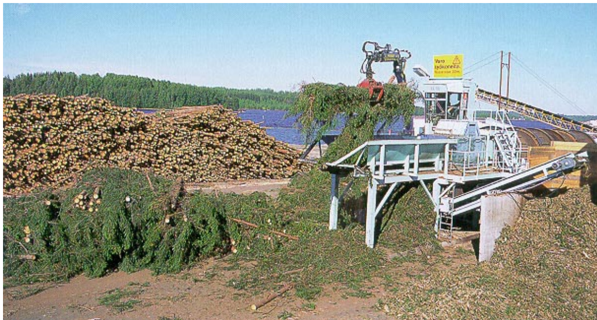
Kuva 2. Pertti Szepaniak Oy:n kehittämä ensiharvennuspuun käsittelyasema Enso Oy:n tehdasvarastolla Kaukopäässä.

Ensiharvennuspuun poikkeavia kuituominaisuuksia voidaan hyödyntää vieläkin pitemmälle, jos se keitetäänkin muusta hakkeesta erillään yksilöllisin kemikaali-, keittoaika-, jauhatus- ja valkaisuäädöin. Saatava erikoismassa voitaisiin ohjata kuituominaisuuksiansa parhaiten vastaaviin erikoispapereihin, joissa painatusominaisuudet ovat repäisy- ja lujuutta keskeisempiä kriteereitä. Esimerkkejä raaka-ainelähtöisestä, puutavaran erityisominaisuuksiin perustuvasta käänteentekevistä tuotekehittelystä ovat aikoinaan olleet esimerkiksi koivusellu, kuusivaneri ja viimeksi haapasellu. Voitaisiko sarjan jatkeeksi liittää myös ensiharvennussellu? Muis-tettakoon, että kysymyksessä ei ole enää vähäinen