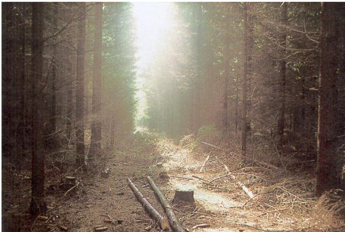
Kuva 1. Huomattavan riskin Keski-Euroopan metsien terveydelle muodostaa parisataa vuotta jatkunut kuusen istuttaminen luontaisen leviämisalueensa ulkopuolelle. Tiheät istutuskuusikot ovat herkkiä kuivuudelle, pakkasille, ilmansaasteille sekä myrsky- ja hyönteistuhoille.

na tehdyt tarkastelut osoittavat kuitenkin Etelä-Suomen kuusten kasvun vaihdelleen koko kuluvan vuosisadan samaan tahtiin touko–kesäkuun sateiden kanssa (Mielikäinen 1996, Henttonen 1984, 1990). Vaihdelu tulee selvästi näkyviin vasta, kun tarkasteltavaksi otetaan useamman vuoden kasvut ja vastaavat sateet. Kasvun vaihtelun mekanismi saattaa olla edellisen perusteella seuraava: